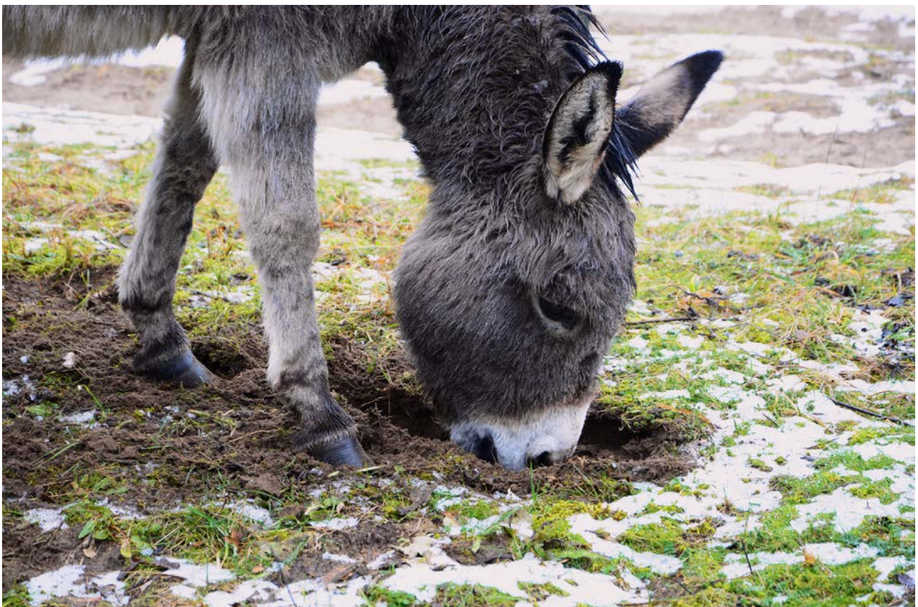
Abb. 4: Esel-Winterbeweidung reduziert überständiges Gras und Gehölze. Zudem werden einige Pflanzen (wie Oenothera biennis und Cynodon dactylon ) gezielt ausgegraben und so bis zu 10 cm tief unter der Erdoberfläche abgebissen (Foto: Andreas Zehm/ANL).

Bei frei lebenden Eseln werden sowohl Stuten- als auch Junggesellengruppen beobachtet. Locker strukturierte Eselgruppen mit zeitweilig bis zu fünfzig (und mehr) häufig wechselnden Tieren (Stuten und Hengste) werden ebenfalls angetroffen (McDONNELL 1998). Adulte Hengste verhalten sich territorial (KLINGEL 1998) und können erfahrungsgemäß nicht als reine Hengstgruppen