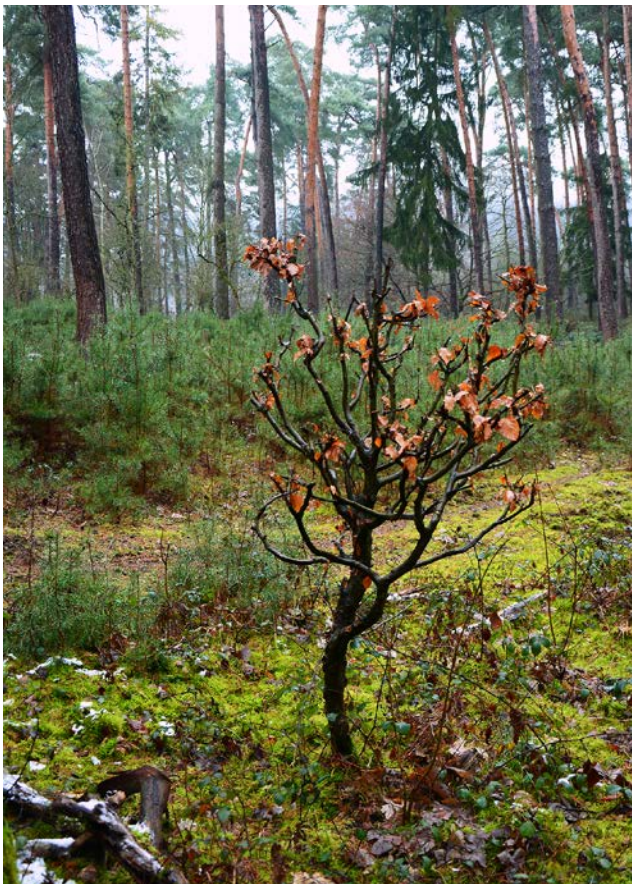
Abb. 3: Eselbeweidung ist sehr gut geeignet, lichte Kiefernwälder zu regenerieren, indem sie offene Bodenstellen schaffen und die darin aufkeimenden Kiefern nicht fressen, sondern von konkurrierender Vegetation freistellen (Foto: Andreas Zehm/ANL).

Auf Flächen, die mit Eseln beweidet werden, sind zahlreiche naturschutzrelevante Effekte zu beobachten. In sandigen Gebieten werden zuverlässig offene Vegetationsverhältnisse geschaffen, wobei die Effekte zuerst an bereits offeneren Stellen einsetzen und sich sukzessive in die dichter bewachsenen Flächen fortsetzen. Esel schaffen offene Bodenstellen vor allem durch Trampelpfade, aber auch indem sie Wälzkühlen anlegen (ROSENTHAL et al. 2012; Abbildung 2) sowie von einigen Pflanzenarten die Wurzeln ausgraben. So wird die Etablierung von Keimlingen konkurrenzschwacher Arten, besonders von Frühjahrs-Therophyten und Sand-Ackerwildkräutern (wie Ajuga chamaepitys und Nigella arvensis ), gefördert (ROSENTHAL et al. 2012; ZEHM et al. 2004). Durch höheres Gewicht und häufiges Nutzen fester Wege entstehen schnell offene Trittpfade, die Sonderlebensräume für zahlreiche Tierarten darstellen. Der starke Verbiss von grasartigen Pflanzen drängt dominante Gräser zurück.