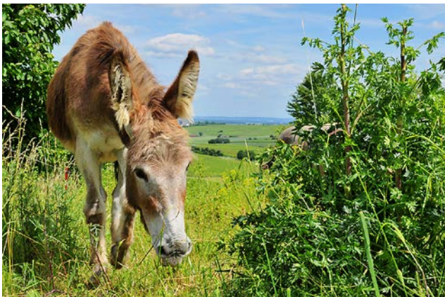
Abb. 1: Esel sind besonders geeignet für die Pflege wertvoller Trocken-Lebensräume, insbesondere da ihre Fraßgewohnheiten optimal helfen, naturschutzfachliche Ziele zu erreichen.

Donkey grazing is a quite effective tool for nature conservation – particularly for high-value grassland – but almost nearly unknown in landscape management. Results show that this kind of grazing is quite helpful in restoring and preserving dry grassland habitats. Sunny Pine forests can also be targeted with donkey grazing, where a combination with other grazing animals or manual landscape management is best practice. Feeding and the disturbance patterns of donkey (trampling, wallows) reduce dominant grass species (like Calamagrostis epigejos ) and promote small growing plants. Moreover, they are more efficient in reducing woody plants than horses and cattle. The article shows what has to be known about animal keeping and pasture management to run a successful conservation project.