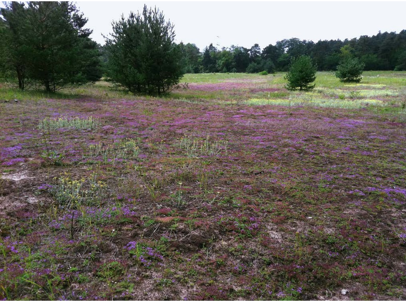
Abb. 6: Aus einem Landreitgras-Dominanzbestand ( Calamagrostis epigejos ) durch wiederholte Eselbeweidung restituerter initialer Sandrasen bei Viernheim/Hessen.

Fig. 6: Former Calamagrostis epigejos stand transferred by repeated donkey grazing into an initial high-value grassland on sandy soil near Viernheim (Hesse).