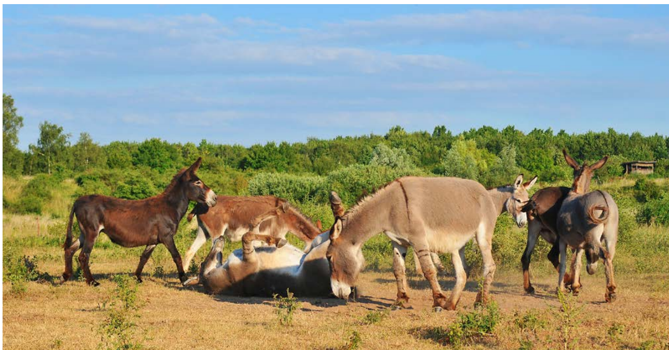
Abb. 2: Esel zeigen ein ausgeprägtes Gruppenverhalten und nutzen gemeinsam Sandbäder und Faecesstellen. Gleichzeitig sind deutlich individuelle Verhaltensunterschiede festzustellen.

Fig. 2: Donkeys are social animals using sand wallows and toilets together. On the other hand they show different individual behaviour.