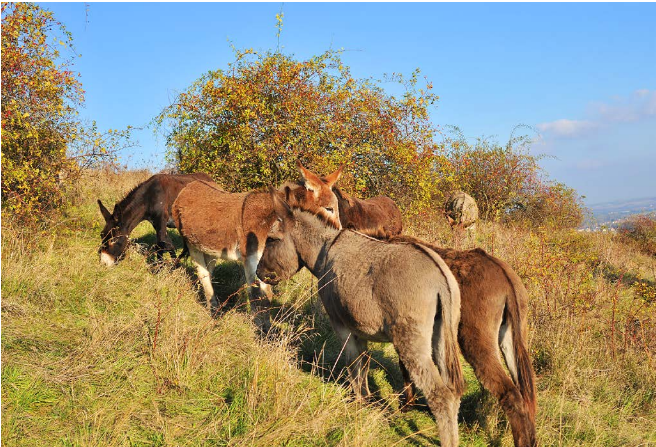
Abb. 5: Esel sind auch zur Wiederherstellung von Lebensräumen geeignet, gerade wenn es – wie auf dieser Weinbergsbrache – darum geht, verfilzte Grasbestände und Verbuschung zurückzuführen.

Fig. 5: Donkeys are also very suitable for the restoration of habitats like former vineyards, particularly if they are characterized by single shrubs and dominant grass layers.