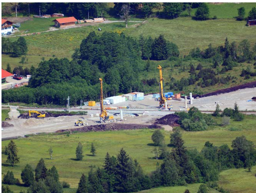
Werden bei Eingriffen in Natura 2000-Gebiete Ausgleichshabitate für Beeinträchtigungen angelegt, führen diese nicht zu einer grundsätzlichen Verträglichkeit des Eingriffs, sondern sind als Teil der Kohärenzsicherung zu werten (Foto: ecoline, Andreas Zehm).

Die Prüfung der Verträglichkeit eines Autobahnbauvorhabens in dem niederländischen Natura 2000-Gebiet „Vlijmens Ven, Moerputten en Bossche Broek“ wurde dem Europäischen Gerichtshof zur Entscheidung vorgelegt. Im Kern ging es um die Frage, ob eine Ausgleichsmaßnahme, hier die Schaffung eines Ersatzhabitates, in die Entscheidung über die Verträglichkeit des Vorhabens einfließen darf. Diese Frage wurde verneint. Nach der Begründung zum Urteil können Ersatzhabitate eine Betroffenheit der Erhaltungsziele oder der für den Schutzzweck maßgeblichen Bestandteile nicht vermeiden helfen, da durch diese eine mögliche erhebliche Beeinträchtigung nicht zweifelsfrei ausgeschlossen werden kann und die Wirksamkeit der Maßnahme zum Zeitpunkt des Eingriffs nicht sichergestellt ist. Daher können entsprechende Maßnahmen für die Fauna-Flora-Habitat-Verträglichkeitsprüfung (FFH-VP) nicht herangezogen werden, sondern können nur bei Vorliegen der Ausnahmevoraussetzungen als Kohärenzsicherungsmaßnahmen anerkannt werden.