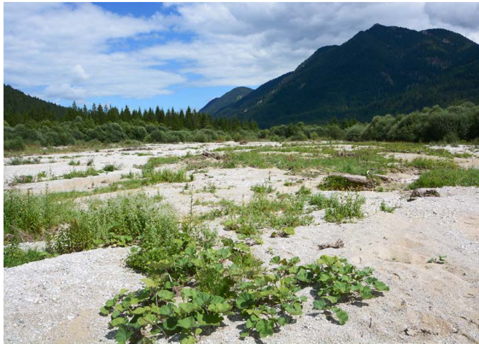
Als Kohärenzsicherungsmaßnahme für einen Eingriff wurde in einer Umlagerungsstrecke der Isar ein die natürliche Dynamik behinderndes Weidengestrüpp entnommen. Teile der Krautschicht sind bereits mit umgelagertem Geschiebe überdeckt (Foto: ecoline, Andreas Zehm).

Die von FÜSSER & LAU (2014) vorgeschlagene zeitliche Entkoppelung der Kohärenzsicherungsmaßnahmen vom konkreten Eingriff und die Integration der „erhaltungszielgegenständlichen Aufwertung“ in Maßnahmenpools könnten durchaus die Verfahren erleichtern bei denen Natura 2000-Gebiete betroffen sind und naturschutzfachlich eine sinnvolle Alternative darstellen. Im Gegensatz zu den vorgezogenen Aus-