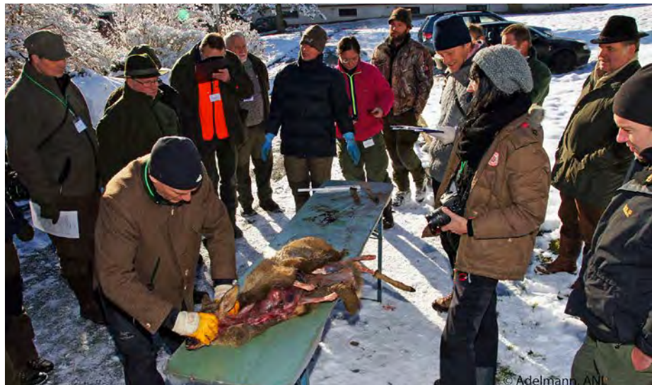
Abb. 4: Spurensicherung am Kadaver lernen – unschöner Anblick, aber absolut notwendig.