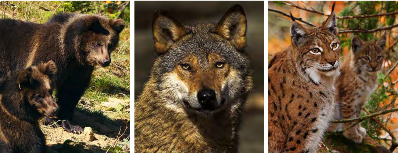
Abb. 1: Die drei großen Beutegreifer mit Relevanz für Bayern: Bär, Wolf und Luchs.

Wo immer in Bayern vermutet wird, dass ein Luchs, Wolf oder Bär seine möglichen Spuren hinterlassen hat, werden die Mitglieder im Netzwerk Große Beutegreifer aktiv und sichern Beweise. Ihrem Einsatz zu Tag- und Nachtzeiten verdanken wir zunehmend mehr Erkenntnisse, wo sich die großen „Drei“ in Bayern aufhalten. Die Bayerische Akademie für Naturschutz und Landschaftspflege unterstützt seit Jahren das Landesamt für Umwelt bei der Ausbildung.