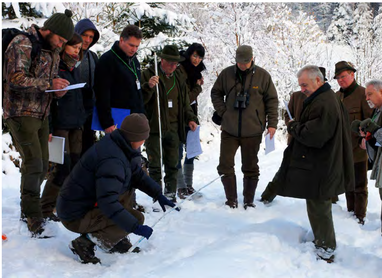
Abb. 5: Ausbildung in der Spurenkunde (Foto: Wolfram Adelman, ANL).

– vermutlich gerissenen – Tier und in dessen Umfeld können bereits einige wichtige Indizien gefunden werden, zum Beispiel Trittsiegel, Haare oder Kot. Der Weidezaun ist ebenso interessant, denn dort lässt sich das mögliche Schlupfloch oder die Übersprungstelle finden. Je nachdem ob Wildtier oder Nutztier, beginnen dann unterschiedliche Untersuchungswege. Nutztiere werden bei Vorliegen hinreichender Indizien grundsätzlich der Untersuchung durch einen Amtstierarzt in der Tierversorgungsanstalt überstellt. Der Netzwerker darf eine Sektion bei Nutztieren niemals selbst durchführen. Bei Wild ist die Einwilligung des Jagdausübungsberechtigten beziehungsweise Jagdpächters erforderlich, damit das Tier nach dem Abhäuten genauer untersucht werden kann. Bei Wildtieren wird der geübte Netzwerker die gesamte Untersuchung somit im Gelände durchführen können. Die Dokumentation im Gelände ist zum Teil sehr aufwendig und kann unter Umständen mehrere Stunden dauern. Und trotzdem wird er im Anschluss kein Ergebnis verkünden können. Es bleibt der Meldeweg über die Fachstelle und damit immer die Abstimmung mit Experten. Dadurch wirkt die Bearbeitung langsam, aber nur so werden Fehlinterpretationen weitgehend ausgeschlossen. Nichts ist schädlicher als eine zu schnelle Festlegung auf einen Verursacher.