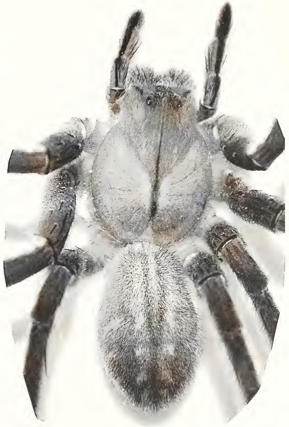
Abb./Fig. 1: Phoneutria boliviensis (F.O. Pickard-Cambridge, 1897), ♀, Groß-Auheim (Import), Habitus.

1 ♀, Deutschland, Hessen, Ginkgoring 70, 63533 Mainhausen-Mainflingen, Lebensmitteldiscount, 50°1'28,89"N, 9°1'3,98"E, 111 m ü. NN, TK25 (Messtischblatt) 5920, in Bananenkisten aus Brasilien, Lisa Kremer leg. 18.07.2009 (subadultes ♀; Reifehäutung: 28.8.2009), Handfang, P. Jäger det., A. Brescovit vid., coll. Senckenberg Forschungsinstitut, SMF.