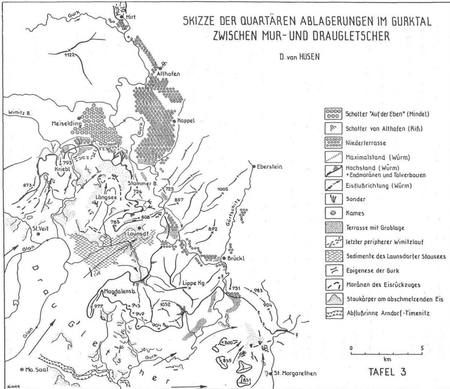
Abb. 4. Skizze der quartären Ablagerungen im Gurktal zwischen Mur- und Draugletscher. Aus: D. VAN HUSEN (1976), Mitt. Geol. Bergbaustud. Wien, 23.