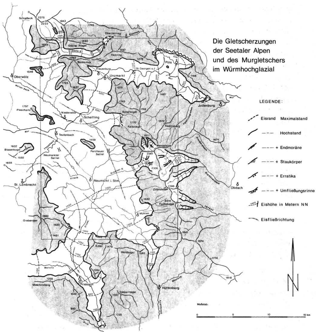
Abb. 3. Die Gletscherzungen der Seetaler Alpen und des Murgletschers im Würmhochglazial. Aus: Erläuterungen zu Blatt 160 Neumarkt in Steiermark.

Wiendorf nach Brückel ihre Fortsetzung, mit der auch die Terrassenschüttung im Görschitztal (D.Schillig 1966) korrespondiert (Tafel 4). Diese Schüttung stellt die Niederterrasse dar, die dann aber am Saualmsüdfuß in der peripheren Abflußrinne nicht mehr weiter zu verfolgen ist.