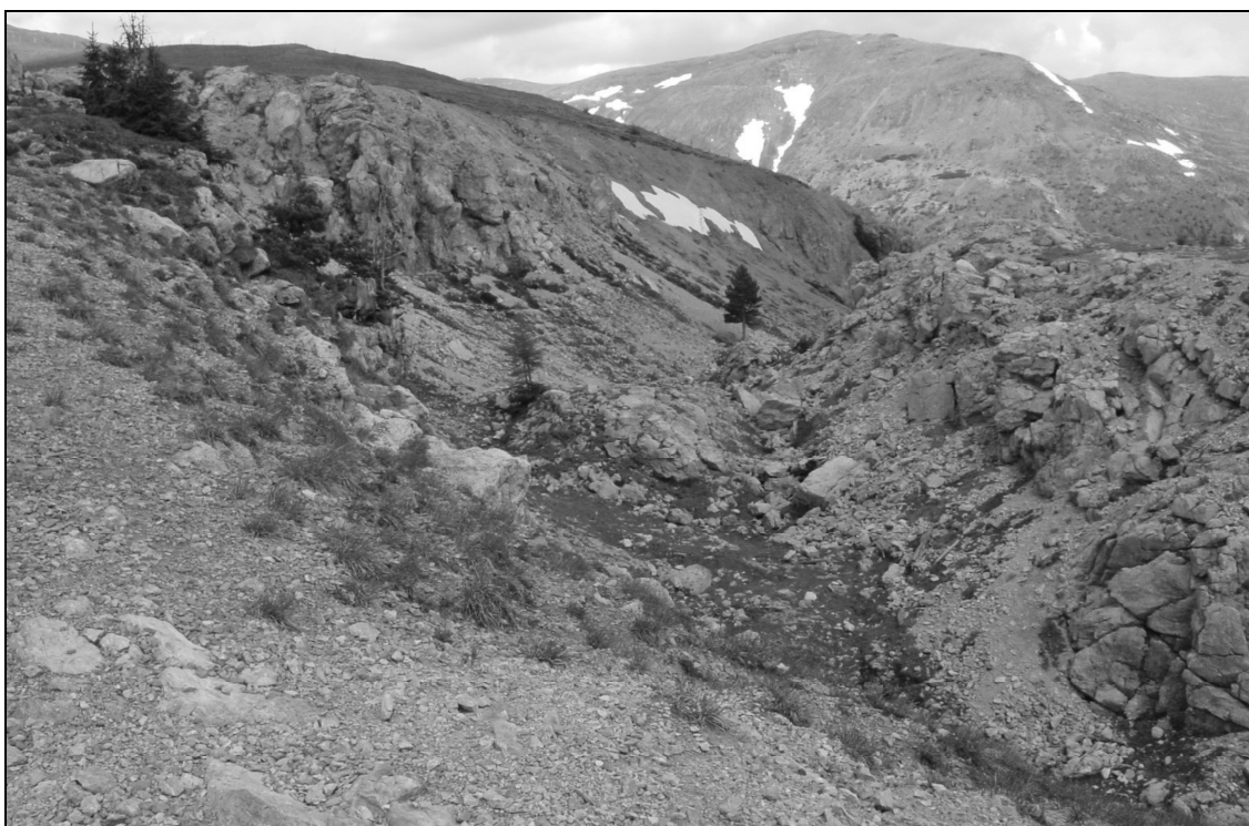
Abb. 3: Massenbewegung bei der ersten Kehre südlich des Parkplatzes Eisentalhöhe. Blick von der Straße Richtung NE auf den Karlnock. Im Vordergrund Dolomite der Hauptdolomit-Formation (Pfannock-Decke), welche auf etwa hangparallel einfallenden Phylloniten (Phyllonitzone) zergleiten.

Der Säuerling liegt in der Ortschaft Zlatting, Gemeinde Trebesing. Zu sehen sind die Quellstube und ein Zierbrunnen mit dem Mineralwasser. Ihrer Lage und dem Lösungsinhalt zufolge findet die Quelle ihr Einzugsgebiet vermutlich in den penninischen, z.T. auch unterostalpinen Karbonaten im Südosten des Sparberkopfes. Aufgrund des hohen CO 2 -Gehalts und der Heliumisotope sind Gaszutritte aus großer Tiefe zu erwarten. In der weiteren Umgebung der Quelle treten Quelltuffe (Kalksinter) auf.