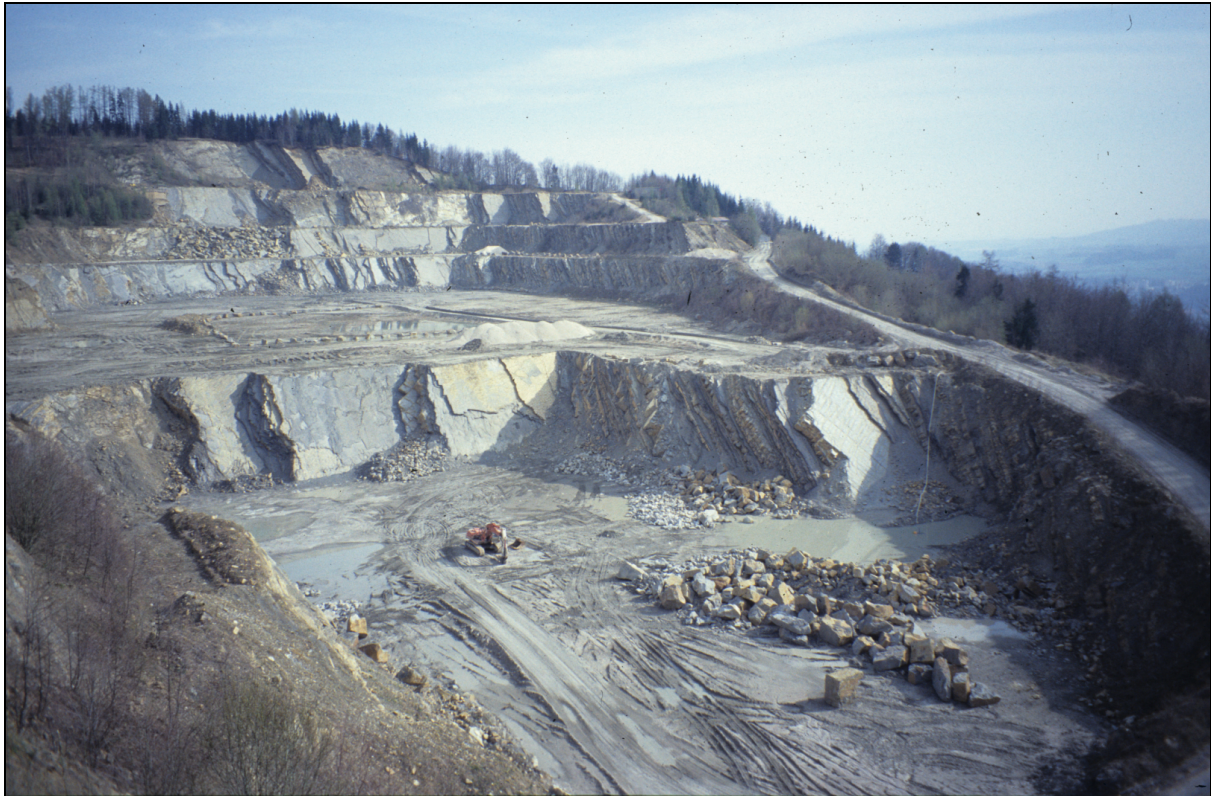
Abb. I: Steinbruch am Pinsdorfberg.

Thema: Altenglach-Formation (Ahornleiten-Subformation)