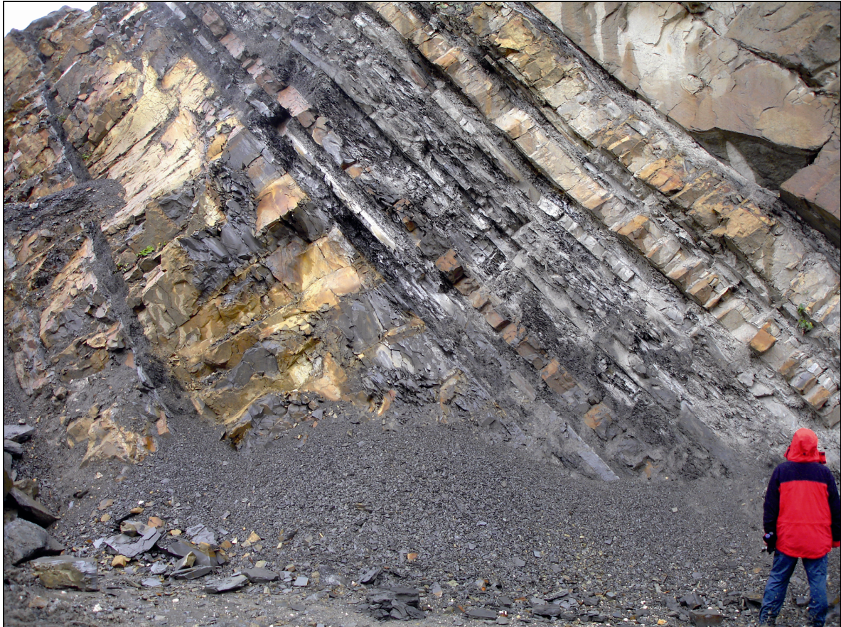
Abb. 2: Lithologie der Ahornleiten-Subformation im Steinbruch am Pinsdorfberg.

Die Abgrenzung der Ahornleiten-Subformation zur liegenden Roßgraben-Subformation ist durch das Auftreten von harten, hellen, scherbilg brechenden Kalkmergeln definiert, welche das Leitgestein der Formation bilden (s. Abb. 2). Die einzelnen Kalkmergellagen können eine Mächtigkeit von bis 8 m erreichen. Sie entwickeln sich jeweils aus turbiditischen, karbonatreichen Hartbänken und bilden den Abschnitt Td des BOUMA-Zyklus. Demgemäß lassen sie in ihren tieferen Anteilen häufig noch einen Gehalt an Siltfraktion erkennen, der gegen das Hangende aufgrund der Gradierung allmählich abnimmt. Einzelne Turbiditlagen (karbonatreiche Wacken und Siltkalke als Hartbänke und die dazugehörigen turbiditischen Kalkmergel) können Mächtigkeiten von bis zu 10m erreichen und sind damit die mächtigsten Turbidite des Rhenodanubischen Flysches überhaupt. Diese „Megabeds“ kommen vor allem im hangenden Teil der Subformation vor, weiter im Liegenden schwanken die Mächtigkeiten der einzelnen Lagen meist zwischen 1 m und 3 m. Die BOUMA-Abfolgen sind in der Ahornleiten-Subformation entweder vollständig oder aber mit fehlenden Basalabschnitten entwickelt. Weiche Tonmergel kommen in der Ahornleiten-Subformation üblicherweise nur selten vor, lokal – z.B. im Steinbruch der Gmunden-Zement am Pinsdorfberg – können sie aber auch verstärkt auftreten.