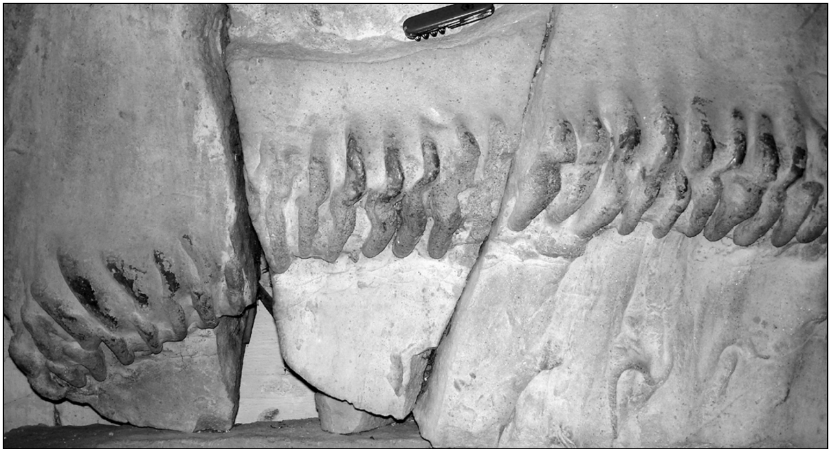
Abb. 3: Pinsdorfichnus abeli aus der Altlenzbach-Formation des Pinsdorfberges.