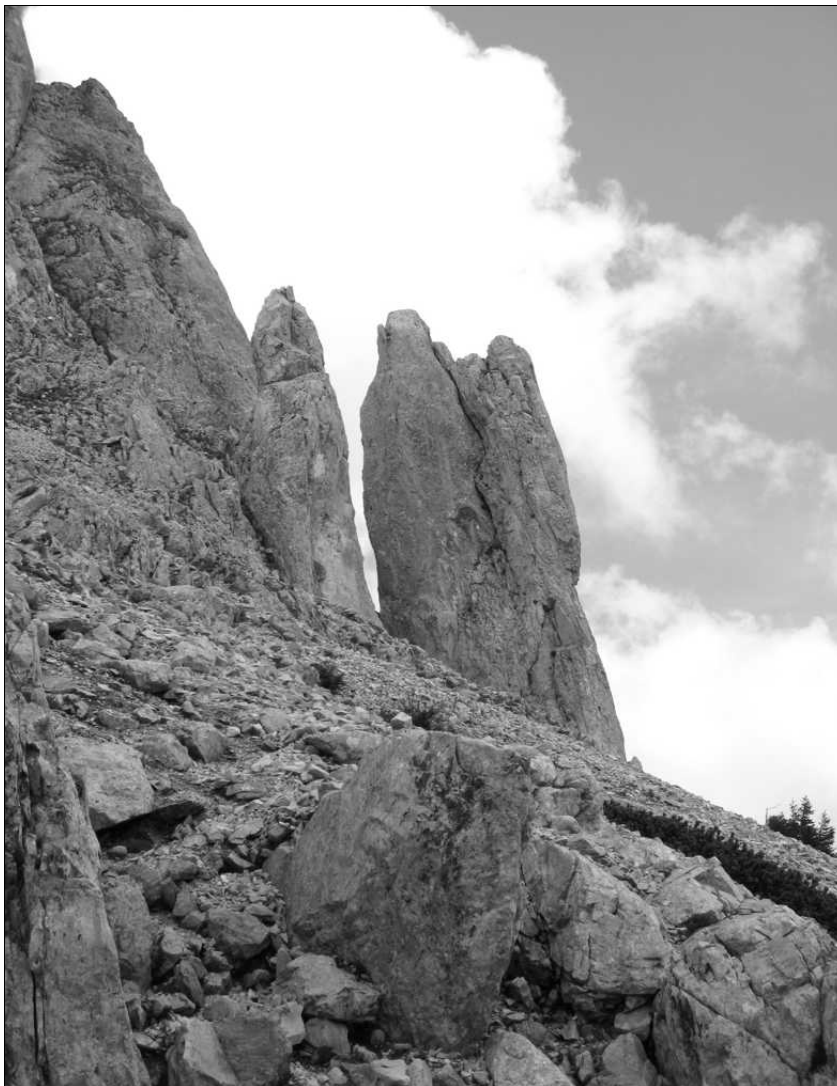
Abb. 2: Translatorisches aufrechtes Abwärtsfahren von turmartigen Großkluftkörpern im Homogenbereich II (Quelle: Foto GBA-Archiv).

Als Ursache dieser Großhangbewegung können in Analogie zu den Prozessen am Hangfuß der Heuschlagmauer sowohl die Lösungsvorgänge, die im Bereich der in die Überschiebungsbahn eingeklemmten Haselgebirgs- und Gipskörper ablaufen, als auch das Versagen der unterlagernden, mechanisch schwachen Werfener Schiefer angenommen werden. Da keine Messungen über die kinematische Entwicklung des Bergzerreißungsprozesses vorliegen und Erkenntnisse über externe Einflussfaktoren (Niederschläge, Schneeschmelze, Frostwirkung) fehlen, ist es sehr schwierig, auf einen einzigen Versagensmechanismus zu schließen. Ausgehend von der Beurteilung des Gesamtbildes der geomechanischen Situation im Gebiet Griesmauer – Heuschlagmauer – Trechtling ist zu vermuten, dass eine Kombination der zwei erwähnten Prozesse als treibende Kraft zu sehen ist.