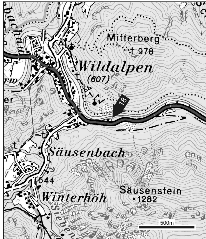
Abb. 20: Sturzstromablagerung östlich Wildalpen

Thema: Der Bergsturz von Wildalpen, Aufschluss im Bergsturzmaterial an der Bundesstrasse oberhalb der Wildalp Abfüllanlage.