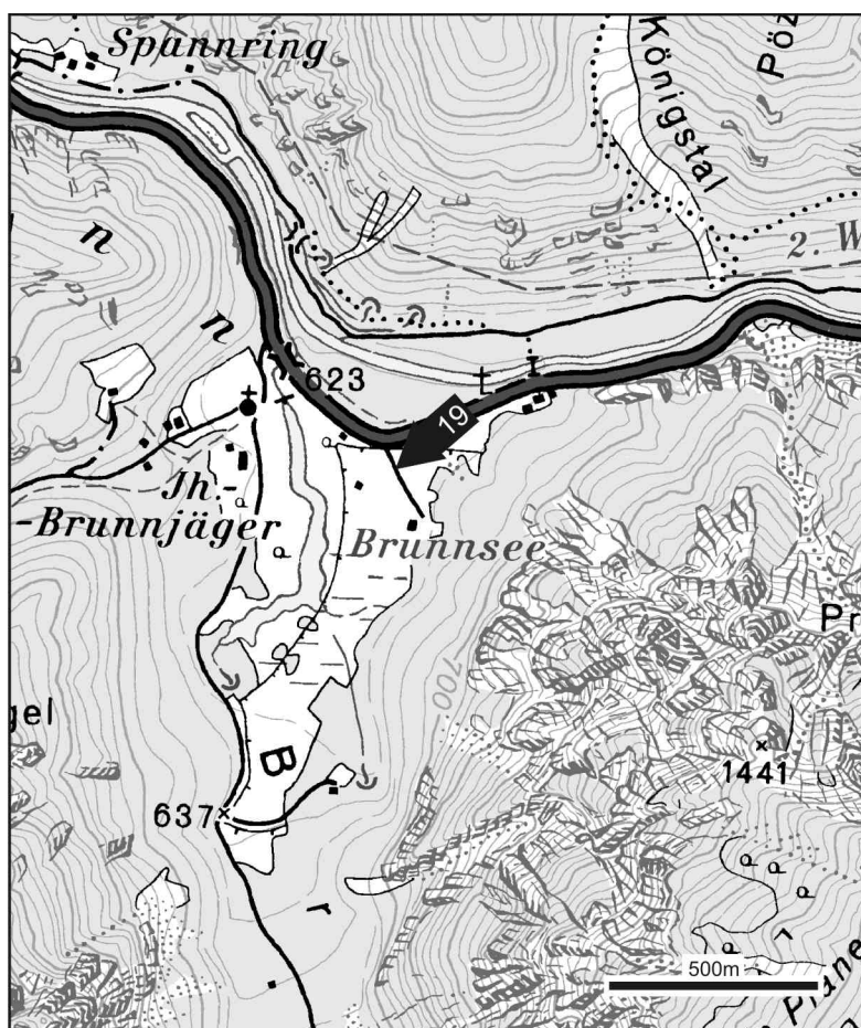
Abb. 21: Lage des Exkursionspunktes im Brunntal

Thema: Schichtfolge und Tektonik der Hochschwab Nordflanke, Quartärgeologischer Überblick, Hydrogeologie der Hochschwab Nordflanke.