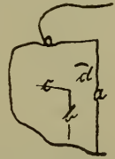
A. canaliculatus , Thorax.