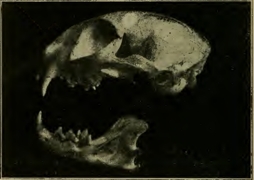
Schädel von Felis caudata macrothrix Zukowsky, ♀ ad., Gebiet östlich des Balkaschsees. Zool. Mus. Kopenhagen, No. 1525.

Bei einem Vergleich des Schädels von F. c. macrothrix mit dem von Felis matschiei Zukowsky l. c. fällt im allgemeinen der gestrecktere und flachere Schädel von F. c. macrothrix auf. Die Jugalia sind viel stärker geschweift, auch viel kräftiger entwickelt und länger, und die Orbitalfortsätze fallen durch die bereits oben erwähnte starke Neigung zur Ringbildung auf. Der postglenoidale