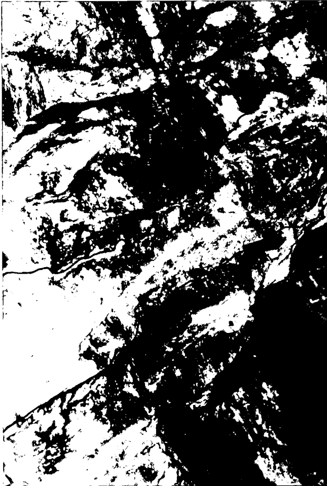
Abb. 3. Mariengrube bei Nikolsdorf: diskordanter Antimonitgang (umrandet). Marienstollen (Firste); Gangmächtigkeit ca. 2 dm.

solche einer Derberzprobe 55,62 % Sb. R. CANAVAL führt die Vollanalyse einer Derberzprobe aus der Mariengrube an, mit 52 % Sb, 0,25 % Pb, 0,15 % As, 21,60 % S und 25,40 % Gangart."