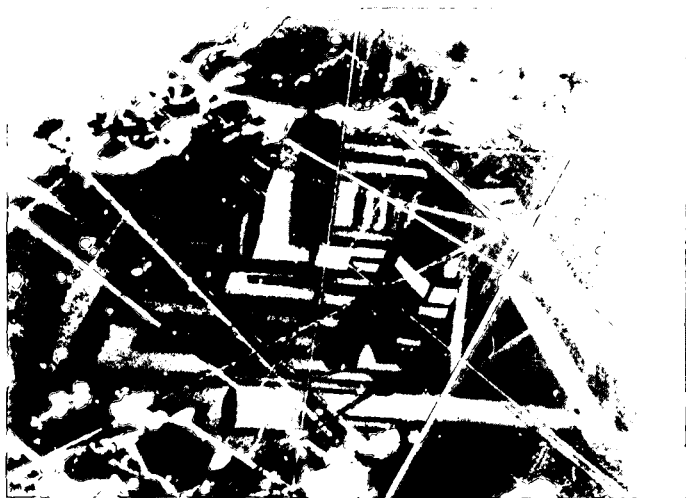
Abb. 3: Kupferkies (dunkelgrau) mit „Oleanderblatt“-Zwillingslamellen eines ehemaligen Hochtemperatur-Kupferkieses. Bildausschnitt 0,34 × 0,23 mm, Nicols +.

Xenomorphe Einschlüsse von decimikronkörnigem Kupferkies sind häufig. Aber auch in Zinkblende, die meist in Vergesellschaftung mit etwas Bleiglanz in oft zusammenhängenden Aggregaten auftritt, und deren Armut an Innenreflexen auf einen hohen Fe-Gehalt hinweist, sind Kupferkies-Entmischungen von Tropfenform oder Leistenform nicht selten. Darüber hinaus verdrängt Kupferkies seinerseits Zinkblende. Solcher frei gewachsene Kupferkies erreicht Korngrößen bis 0,3 mm und läßt randlich eine sekundäre Umbildung zu Covellin erkennen. In wenigen Fällen konnten die typischen lanzettartigen Zwillingslamellen beobachtet werden, die auf Entmischung eines nur bei Temperaturen über 550° C gebildeten kubischen Hochtemperaturkristalls hindeuten (Abb. 3).