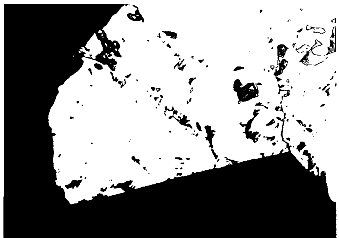
Abb. 4: Magnetkies (mittelgrau) mit helleren, flammenförmigen Pentlandit-Einlagerungen; etwas Pyrit (weiß); Quarz (schwarz). Bildausschnitt 0,28 × 0,18 mm, 1 Nicol.

Pentlandit in seiner typisch flammenförmigen, von Klüften und Spaltrissen aus in das Korn hineinragenden Ausbildung, ist als Einschluß im Magnetkies nachweisbar. Auch dieser Befund spricht für hohe Bildungstemperaturen (Abb.4).