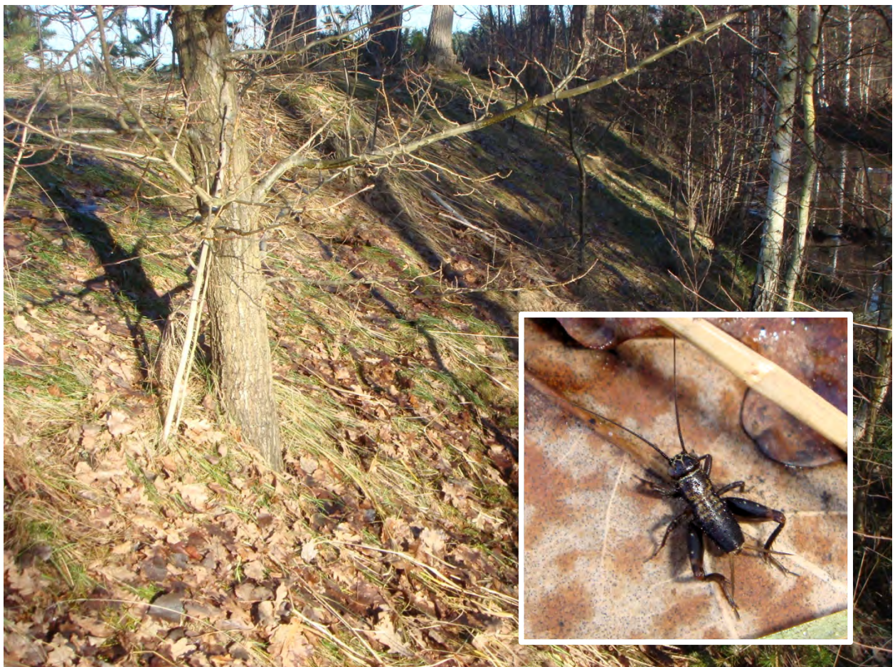
Abb. 2: Südostexponierte Uferböschung mit lockerem Eichen-Kiefern-Mischwald als Habitat von Nemobius sylvestris bei Neustadt an der Spree / Sachsen; Mitte Januar 2011. Kleines Foto: Sich sonnende juvenile Waldgrille (N-IV/V) auf trockenem Eichenlaub an einer Uferböschung der Struga bei Neustadt an der Spree / Sachsen; 17.01.2011