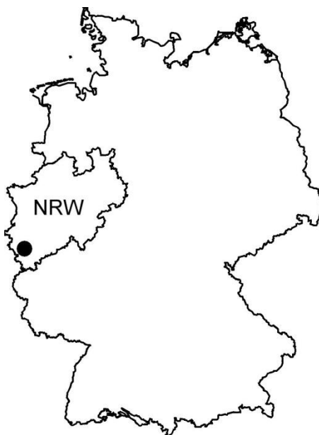
Abb. 1: Lage des Untersuchungsgebietes (Nordeifel, Kreis Düren, NRW).

Das Untersuchungsgebiet (UG) umfasst Flächen im Kermeter und im Hürtgenwald (einschließlich des Kalltals), zwei zusammenhängenden Waldgebieten in der Nordeifel, Kreis Düren, NRW.