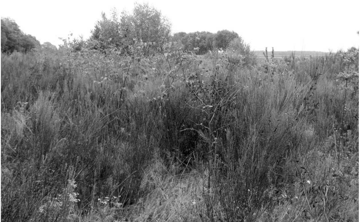
Abb. 3: Habitat der Sichelschrecke mit Besenginsterbestand in Steinloge

In diesem weniger als 20 ha großen, aber sehr heterogenen Bereich wurden 13 weitere Heuschreckenarten nachgewiesen.