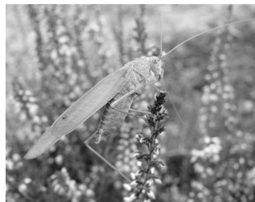
Abb. 2: Sichelschrecke ( Phaneroptera falcata) am 21.8.2011 auf der Großen Höhe bei Ganderkesee.