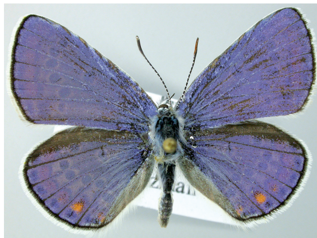
Abbildung 3 zur Arbeit in SEIZMAIR, M., Bemerkenswerte Rhopaloceren-Nachweise in Israel (Lepidoptera, Pieridae et Lycaenidae), Seiten 105-109: Plebeius pylaon cleopatra (HEMMING, 1934), ♂, 3 km N Dimona, 21.III.2011.