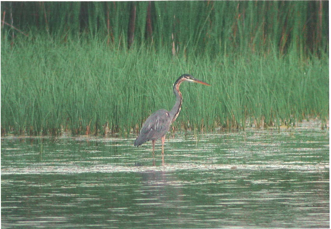
Abb. 1: Hybride aus Purpurreiher Ardea purpurea und Graureiher Ardea [cinerea] cinerea , Neusee bei Mönchstockheim, Kreis Schweinfurt, Juni 2004. Strukturell durch den kräftigen Hals an Graureiher erinnernd, Schnabel jedoch relativ schlank. Ein eindeutiger Hinweis auf die Elternschaft eines Purpurreihers ist der dunkle Streif zwischen Schnabelwinkel und Nacken und auch die übrige Kopf- und Halszeichnung spricht für eine Beteiligung dieser Art. Weitere Färbungsdetails sind intermediär zwischen Grau- und Purpurreiher. – Hybrid between Purple Heron and Grey Heron. Overall structure more similar to Grey Heron, especially the strong neck. The slender bill is more reminiscent of Purple Heron. The black, white, grey and brown parts of the plumage are intermediate between Grey and Purple Heron, but the black stripe below the eye is only found in Purple Heron and in no other heron or egret species.

bung von Bauch, Brust und Hals ließ zunächst an einen Purpurreiher A. purpurea denken, es wurden in der Beobachtergruppe jedoch sogleich einige zu dieser Bestimmung nicht passende Merkmale diskutiert. Der erste Blick durch ein Spektiv verblüffte aufs Neue – der Reiher war nun von schräg hinten zu beobachten und erschien wie verwandelt: Der graue Hinterhals und die graue Oberseite wiesen nun eher auf einen Graureiher hin.