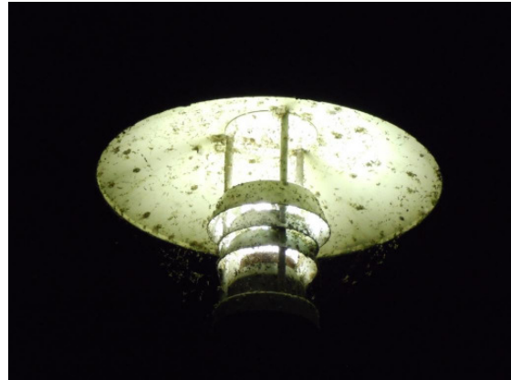
Strassenbeleuchtung mit unzähligen verschmorten Insekten

Allerdings wäre es völlig falsch zu meinen, dass Licht für einige Fledermäuse schädliche, für andere jedoch positive Auswirkungen hat. Jede Nacht kommen an den Straßenlampen, deren Licht Insekten unwiderstehlich anzieht, Millionen von Insekten um.