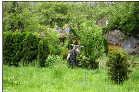
Suche des Aufenthaltsorts mit der Antenne

Fledermaus jagt und wie große Entfernungen sie zurückgelegt.