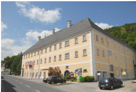
Kloster und Kirche Forchtenstein im Europaschutzgebiet Mattersburger Hügelland. Fortpflanzungsquartier der Großen Hufeisennase und der Wimperfledermaus.

Nach Artikel 11 der FFH-Richtlinie hat der Mitgliedstaat, im Fall Österreichs jedes Bundesland, die Qualität der Lebensbedingungen der betroffenen Arten zu überwachen. Alle sechs Jahre müssen die Ergebnisse dieser Überwachung (Monitoring) des Zustands der Populationen nach Brüssel gemeldet werden (Art. 17). Die Berichte werden der Öffentlichkeit zugänglich gemacht.