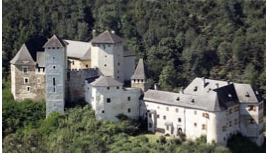
Burg Lockenhaus im Europaschutzgebiet Bernstein-Lockenhaus-Rechnitz. Fortpflanzungsquartier der Wimperfledermaus von europäischer Bedeutung.

In diesen Plänen sind nicht nur die Sommer- (Wochenstuben)- und Winterquartiere der betroffenen Arten verzeichnet, sondern auch der um die Sommerquartiere liegende Nahrungsraum gekennzeichnet. In diesen Gebieten muss artspezifische Nahrung in ausreichender Menge erhalten bleiben.