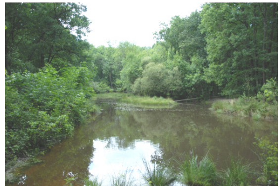
Nahrungshabitat der Anhang IV-Arten Fransenfledermaus und Große Bartfledermaus. Teich im Wald Gornja loza, Gemeinde Großwarasdorf.

Alle im Burgenland vorkommenden Fledermausarten, sind Anhang IV der FFH-Richtlinie aufgelistet. Sie ebenfalls streng geschützt. Speziell dürfen ihre Fortpflanzungsstätten nicht gestört oder gar vernichtet werden. Auch ihnen gilt ein besonderes Augenmerk von BatLife Österreich, damit ihre Vorkommen vor Gefährdungen geschützt werden können.