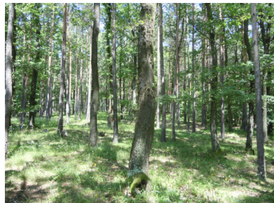
Europaschutzgebiet Bernstein-Lockenhaus-Rechnitz. Nahrungshabitat des Großen Mausohrs im Erbwald, Gemeinde Pilgersdorf

Die Burgenländische Landesregierung hat in Ergänzung zu den schon in den Jahren 2007-2008 erlassenen Verordnungen im November und Dezember 2013 die Europaschutzgebiete „Bernstein-Lockenhaus-Rechnitz“, „Mattersburger Hügelland“, und „Südburgenländisches Hügel- und Terrassenland“ verordnet. In diesen Verordnungen sind sämtliche Örtlichkeiten, in denen Fledermäuse des Anhangs II leben, auch Gebäude, namentlich aufgezählt, um die Schutzbemühungen, effizient und transparent zu gestalten.