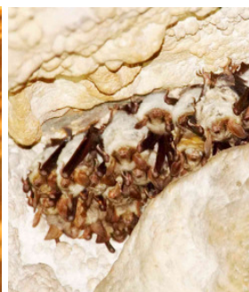
Große Mausohren im Winterschlaf

Die Burgenländische Landesregierung hat in Ergänzung zu den schon in den Jahren 2007-2008 erlassenen Verordnungen im November und Dezember 2013 die Europaschutzgebiete „Bernstein-Lockenhaus-Rechnitz“, „Mattersburger Hügelland“, und „Südburgenländisches Hügel- und Terrassenland“ verordnet. In diesen Verordnungen sind sämtliche Örtlichkeiten, in denen Fledermäuse des Anhangs II leben, auch Gebäude, namentlich aufgezählt, um die Schutzbemühungen, effizient und transparent zu gestalten.