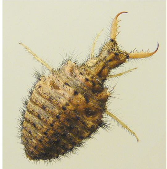
Abb. 1: Der Ameisenlöwe, Myrmeleon formicarius , L3, Insekt des Jahres 2010. Erstmals fällt dieses besondere Prädikat auf eine Insekten-Larve.

und in den Medien zu finden. Zu oft nur unter den fragwürdig vereinfachten Überbegriffen „Nützlinge, Schädlinge oder Lästlinge“. Manche dieser Berichte können jahreszeitlich und witterungsabhängig inzwischen prognostiziert werden. Dabei fällt immer wieder auf, dass nur ausnahmsweise konkrete Arten angesprochen werden. Oft ist nur pauschal von Gattungs-, Familien- oder überhaupt nur von Ordnungsgruppen