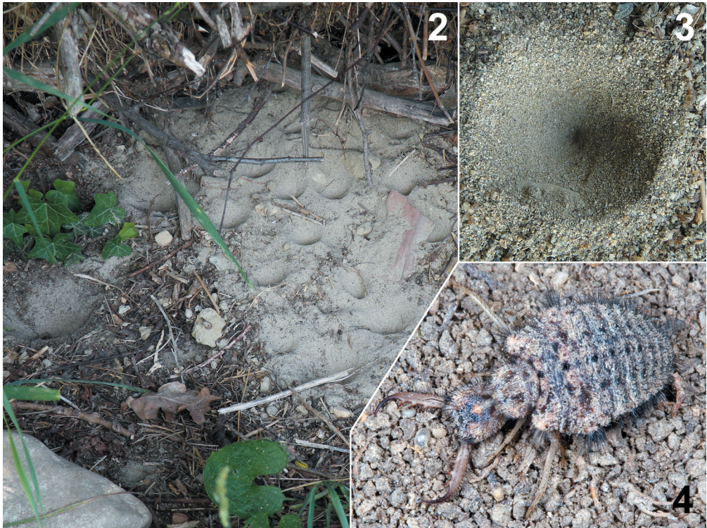
Abb. 2-4: 2: Kolonie von mindestens 16 Trichterfallen mit Ameisenlöwen verschiedener Stadien von Myrmeleon formicarius , in einem für sie typischen regengeschützten Kleinhabitat. 3: Trichterfalle mit 7 cm Durchmesser. 4: Ausgegrabener Ameisenlöwe im 3. Larvenstadium auf der Sandoberfläche seines Habitats (Fotos: H. Rausch (2); J. Gepp (3); H. Bellmann (4)).

trägt hingegen den Trivialnamen Ameisenjungfer. Die faszinierenden präimaginalen Stadien der Insekten ganz allgemein und die der Myrmeleontiden besonders stellen auch aus pädagogischer Sicht bestens geeignete Lern- und Demonstrationsobjekte dar, und das trifft sich ebenfalls mit den Absichten, die hinter den Aktivitäten zum „Insekt des Jahres“ stehen.