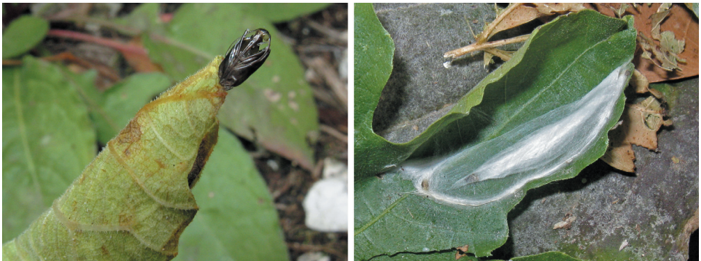
Abb. 2: Choreutis nemorana , Puppenwickel nach dem Schlüpfen des Schmetterlings. Links intakt (mit Exuvie), rechts geöffnet.

Fig. 1: Choreutis nemorana . Feeding marks of caterpillars on fig leaves.