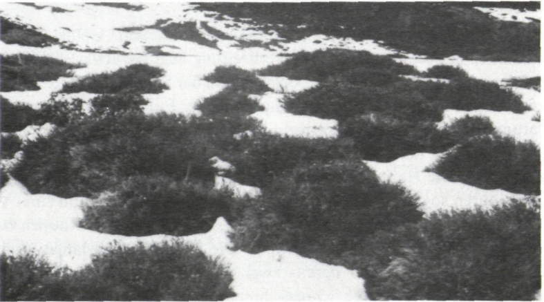
Tafel 1: a: Seit 1951 untersuchter Lebensraum von Eriogaster arbusculae FRR. im Arzthal (Tuxer Voralpen) zu Beginn der Flugzeit (11.5.1968) b: Derselbe Hang gegen Ende der Flugzeit (1.7.1967) c: Typisches Ausaperungsbild in einer B-Zone.