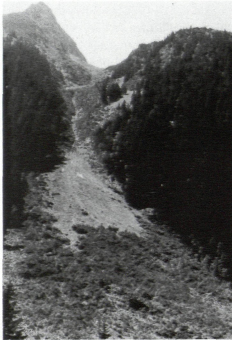
Abb. 2: Lebensraum im innersten Gschnitztal, wo hybride Paarungen von Eriogaster arbusculae und lanestris in freier Natur vorkommen können.

sich am unteren Ende der Lawinenschneise und am Waldrand hinauf bis zur Engstelle in etwa 1500 Meter befinden (Bildmitte). Bereits 300 bis 400 Meter höher findet man die ersten arbusculae -Gelege. Deshalb ist es auch nicht verwunderlich, daß man unter den lanestris -Raupen dieses Biotops Tiere findet, die den hybriden Raupen sehr ähnlich sind. Die lange unter Lawinenschnee liegenden lanestris schlüpfen verspätet und kommen so mit den ersten arbusculae ♂♂ zusammen, für die die Überwindung einiger hundert Höhenmeter keine Schwierigkeit bedeutet. Für den Einfluß von arbusculae ♂♂ in diesem Gebiet spricht auch das abnormale Verhältnis von 8 bis 10 ♂♂ zu einem ♀ (bei reinen Stämmen ist das Verhältnis ja nur 3 bis 4:1 für die ♂♂).