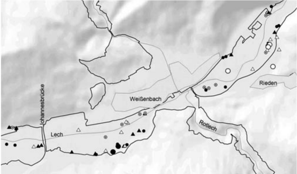
Abb. 3: Unterschiede in der Laichplatzdichte und Größe der Laichgesellschaften des Grasfroschs ( Rana temporaria) in der Lechhau bei Weißenbach / Rieden („erweiterter Untersuchungsraum inklusive Kerngebiet) zwischen 1990 (offene Symbole) und 2003 (geschlossene, schwarze Symbole): Große Punkte (Kreise):=> > 100, Dreiecke = 25-99, kleine Punkte (Kreise) = < 25 Laichballen. Schwarze Linie: Grenzen des Natura 2000-Gebietes. Karte genordet.

auch ober- und unterhalb der Mündung des Weißenbachs am linken Ufer, die Zahl der Fundpunkte und v.a. die Größe des Laichbestandes z.T. stark abgenommen. Während sich insgesamt (Daten beider Ufer) im Gebiet oberhalb der Mündungen von Rotlech und Weißenbach zwischen 1990 und 2003 die Zahl der registrierten Laichballen von 361 (an 12 Laichplätzen) auf 1006 an 19 Standorten erhöhte, sank im selben Zeitraum im erweiterten Untersuchungsraum unterhalb der beiden Seitenbäche die Laichballendichte von 956 (14 Laichplätze) auf 361 (12 Plätze) ab (Abb. 3).