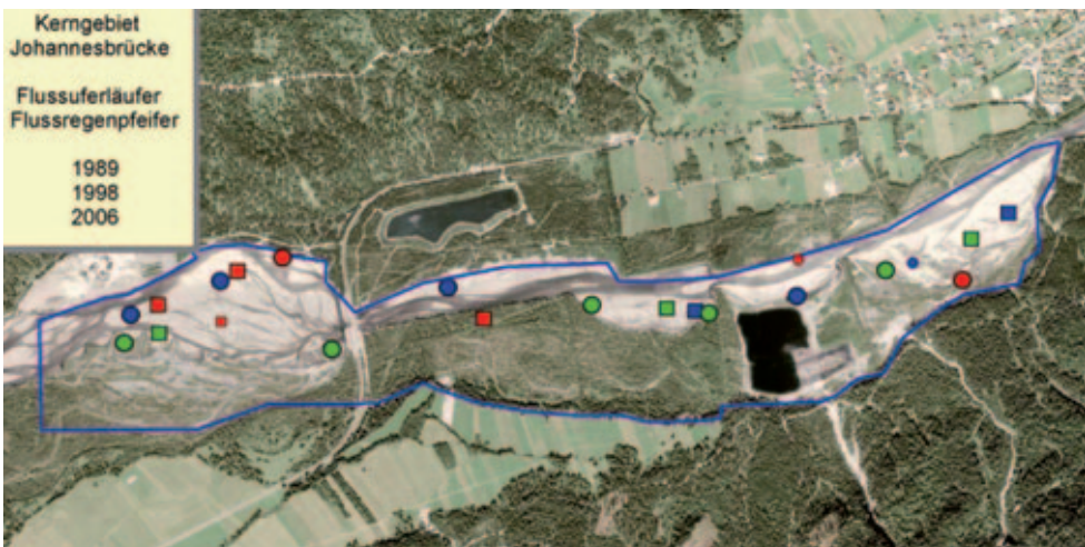
Abb. 4: Anzahl und Verteilung der Reviere von Flussregenpfeifer (Quadrate) und Flussläufer (Kreise) im Untersuchungsgebiet um die Johannesbrücke bei Weißenbach 1989 (Grüne Symbole), 1998 (Blau) und 2006 (Rot). Etwaige Lage der Revierzentren (z.T. Neststandorte). Kleine Symbole: = unsichere Reviere. Habitatverhältnisse vor Aufweitung Sommer 2002. Blaue Linie: Grenzen des Untersuchungsgebietes (Kerngebiet) ca. 3,5 km Länge: Karte genordet.

In der Tab. 2 sind v.a. für das Areal rechts unterhalb der Johannesbrücke auch relative