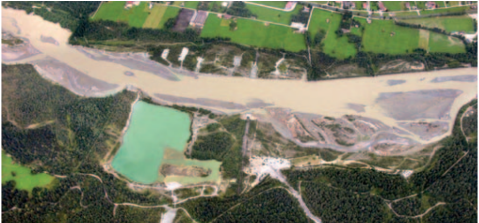
Abb. 1: Untersuchungsgebiet Flussaufweitung Johannesbrücke (Kerngebiet) im Sommer 2005 nach Durchführung der Aufweitung.

Bild a: Bereiche um die Johannesbrücke (kleiner Teilbereich am Oberrand nicht im Bild). Die beiden neuen Flussinseln unterhalb der Brücke geben etwa die ehemalige Uferlinie in diesem Abschnitt wieder (vgl. auch Abb. 2 & 4).