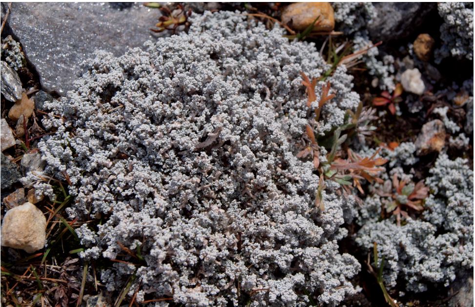
Bild 8: Auf Moränen und im Gletschervorfeld ist die Strauchflechte Stereocaulon alpinum verbreitet.