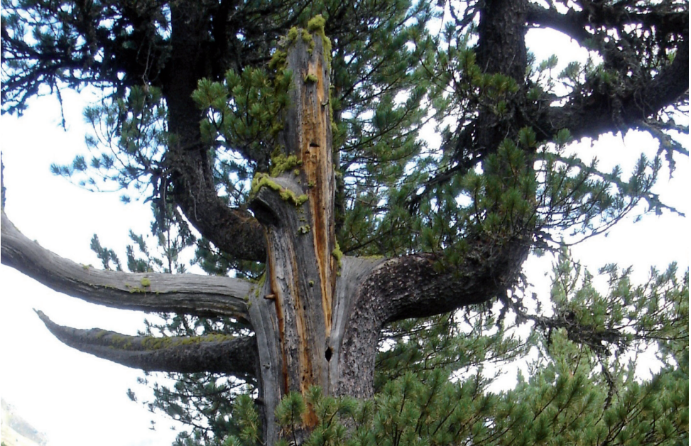
Bild 1: Pinus cembra im Obergurgler Zirbenwald mit Bewuchs von Letharia vulpina (Gelbe Wolfsflechte).