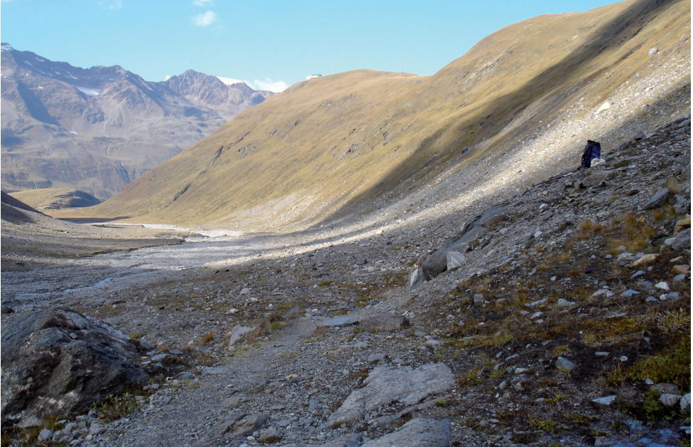
Bild 5: Im Gletschervorfeld des Rotmoostales mit algenreichen Nassstellen, am Talausgang das Rotmoos.