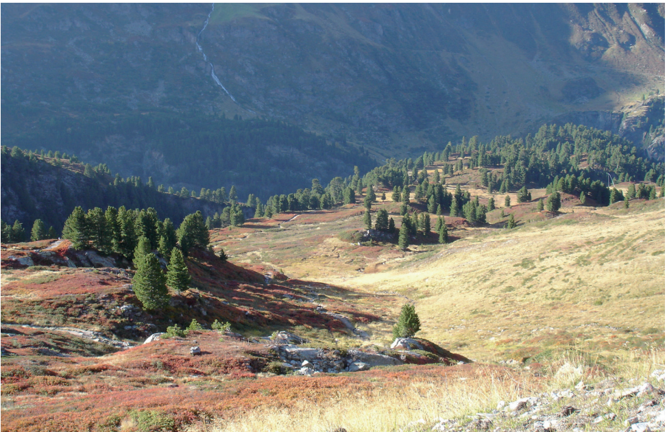
Bild 2: Die kryptogamenreichen Moore im Bereich des Obergurgler Zirbenwaldes im Herbst.