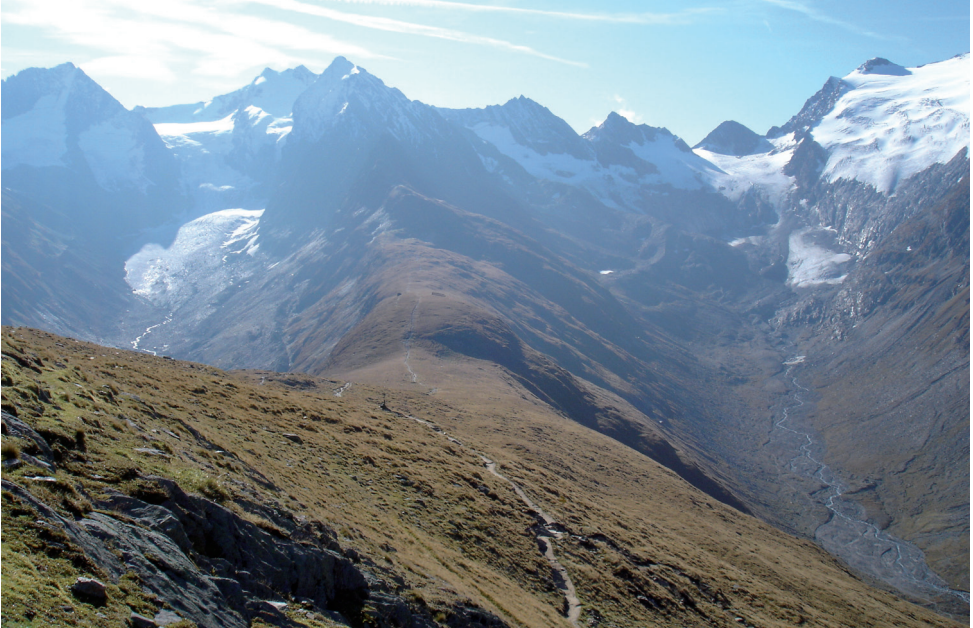
Bild 3: Der gletschergeformte Rücken der Hohen Mut gegen die Talschlüsse des Gaisbergtales (im Bild links) und Rotmoostal (rechts).