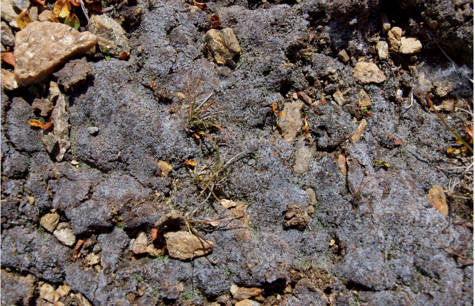
Bild 7: Lebermoos Anthelia juratzkana mit grauweißlichem Wachsüberzug in durchfeuchteten Schneeböden.