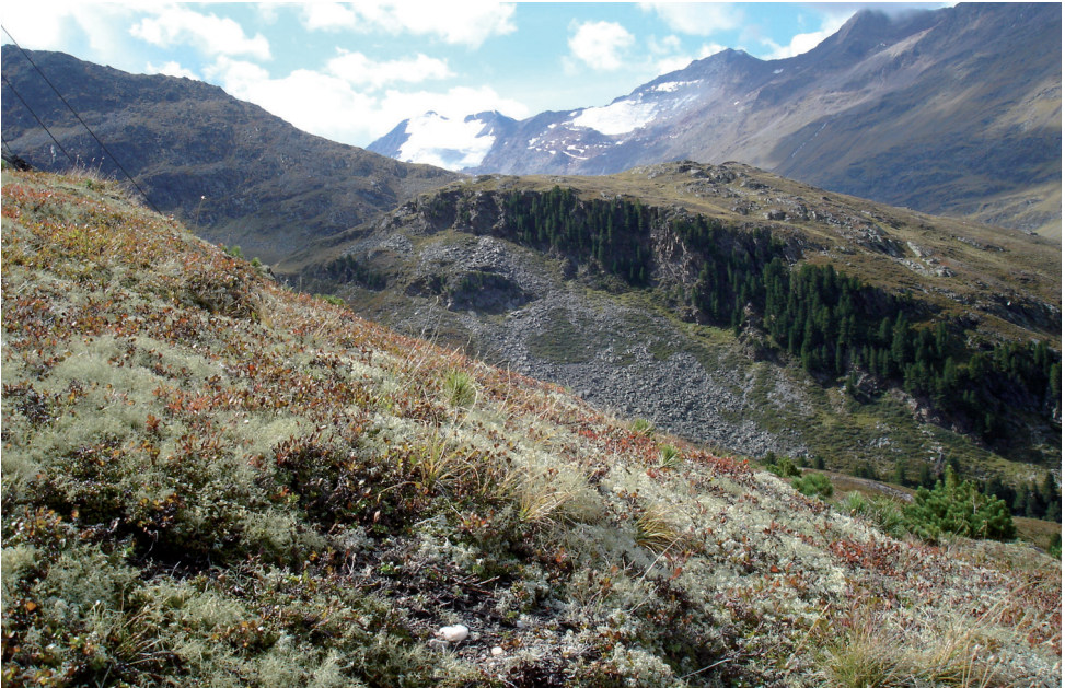
Bild 4: Zwergstrauchheide mit Strauchflechtengesellschaft aus Cladonia stellaris , Cl. rangiferina , Flavocetraria cucullata , Fl. nivalis , Alectoria ochroleuca u.a.