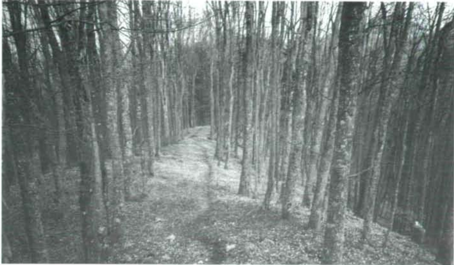
Abb. 2: Im Gipfel-Eschenwald auf dem Landsberg

Deckungswerte. Die nur geringfügig vorhandene Strauchschicht wird von Corylus avellana und Rubus idaeus gebildet. Literaturhinweise über andere Gipfel-Eschenwälder gibt es nur aus dem Osten Österreichs, nämlich aus dem Wienerwald, von den Hainburger Bergen und dem Leithagebirge. Erstmals erwähnt wurde der Gipfel-Eschenwald durch NEILREICH (1846) aus dem Wienerwald. BECK (1890) beschäftigte sich erstmalig mit den Bodenpflanzen und dem Auwaldcharakter dieser Waldgesellschaft.