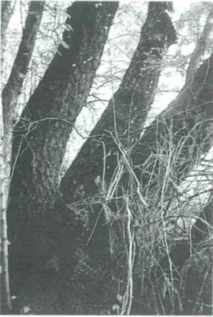
Abb. 1: Brutbaum von S. scoliaeformis (18.6.1994, Sattledt)