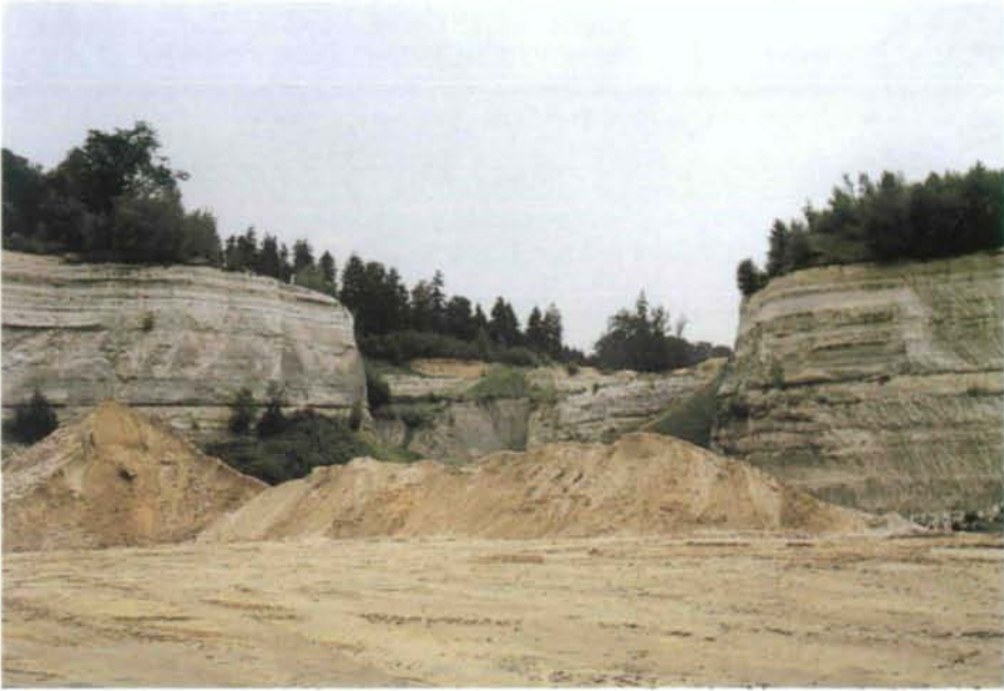
Abb. 2: Steile Quarzsandwände und offen Sandflächen in Knierübl-Nord; 9. Juni. 1995.