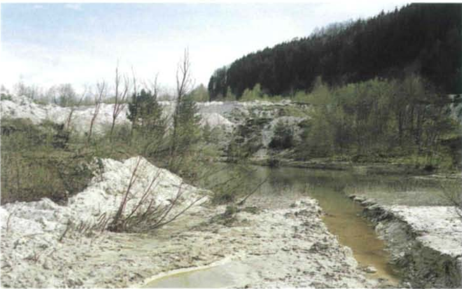
Abb. 3: Grundwasserteich im zentralen Teil von Weinzierl in Kontrast mit vegetationslosem Kaolin; 21. April 1995.