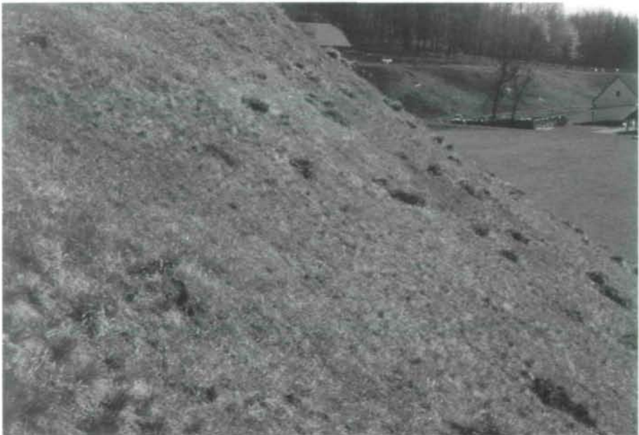
Abb. 2: Kuhschellenböschung Neuzeug