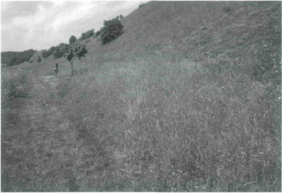
Abb. 1: Halbtrockenrasen am Keltenweg