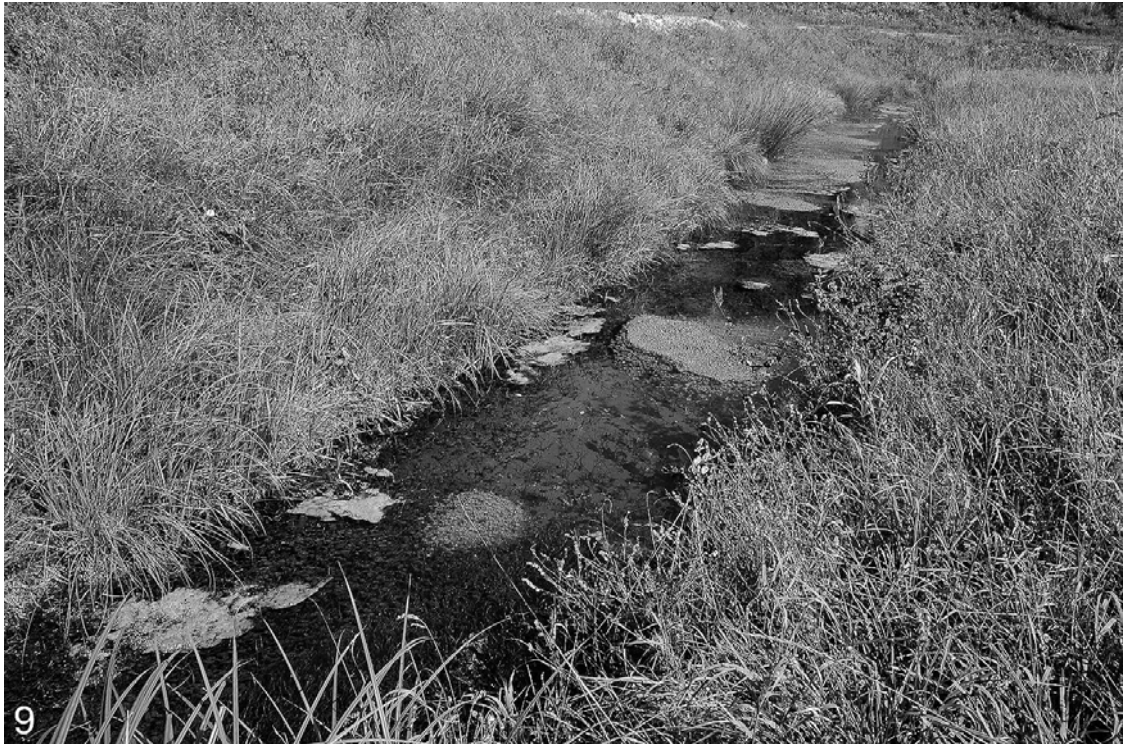
Carex vulpinoidea – Fuchsseggenähnliche Segge