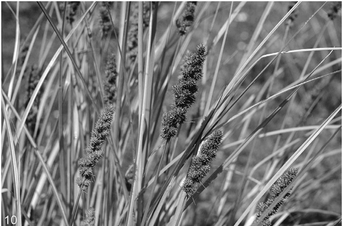
Abb. 10: Der bisher zweite Fund der aus Nordamerika stammenden Fuchsseggenähnlichen Segge ( Carex vulpinoidea ) in Oberösterreich.