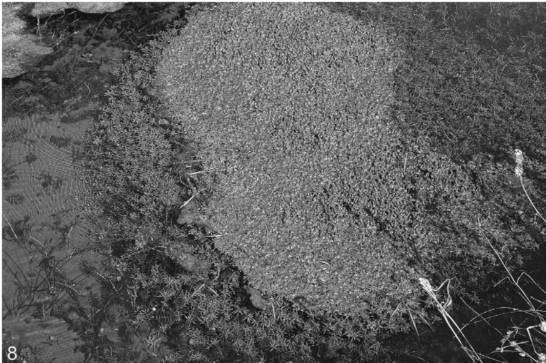
Abb. 8 und 9: Der Nussfrüchtige Wasserstern ( Callitriche obtusangula ), wie er reichlich in den Sickergräben der Innauen bei Höft/Braunau am Inn wächst – hier etwa gemeinsam mit dem Fischkraut ( Groenlandia densa ).

Beeindruckend sind die großen flutenden Wasserstern-Polster in den Quell- und Sickergräben der Auen am unteren Inn. Nur trifft man leider ganz selten auf fruchtende Pflanzen. Dieser Fund bestätigt meine Vermutung, dass es sich bei den großen Vorkommen am Inn meist um den Nussfrüchtigen Wasserstern handeln dürfte (Abb. 8 und 9). Als Begleitpflanzen im Sickergraben bei Braunau am Inn/Höft wurden folgende Arten notiert: Berula erecta , Groenlandia densa , Lemna trisulca , Nasturtium officinale agg., Potamogeton berchtoldi , Veronica anagallis-aquatica , Veronica beccabunga . In den umliegenden Gräben sind zusätzlich noch folgende weitere Arten verbreitet: Elodea canadensis , Fontinalis antipyretica , Potamogeton crispus , Potamogeton pectinatus , Ranunculus trichophyllus , Sparganium emersum .