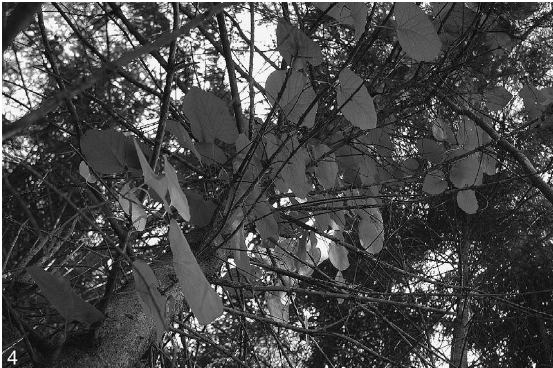
Abb. 4 und 5: Die Amerikanische Pfeifenwinde ( Aristolochia macrophylla ) als verwilderte Kletterpflanze auf einer Fichte am Aichberg bei Antiesenhofen.

PILSL & al. (2008) berichten vom ersten Nachweis dieser Art aus Österreich, und zwar in Form eines Herbarbeleges im Herbarium SZB, welcher im Jahr 1899 in der Stadt Salzburg unter dem Namen Aristolochia siphon gesammelt wurde. In Oberösterreich gelang der erste und bislang einzige Nachweis im Jahr 1949, wo A. macrophylla von E. Putz am Königsweg in den Urfahrwänden als Gartenflüchtling festgestellt wurde (Herbarium LI). Auch die Pflanze in Antiesenhofen (Abb. 4 und 5) dürfte das Resultat von ausgebrachten Gartenabfällen sein, denn in deren Nähe wächst auch die Zitronen-Melisse ( Melissa officinalis ). Über eine Verwilderung in Deutschland berichtet ADOLPHI (1983). Die Bestimmung erfolgte mit Hilfe des Schlüssels in JÄGER & al. (2008).