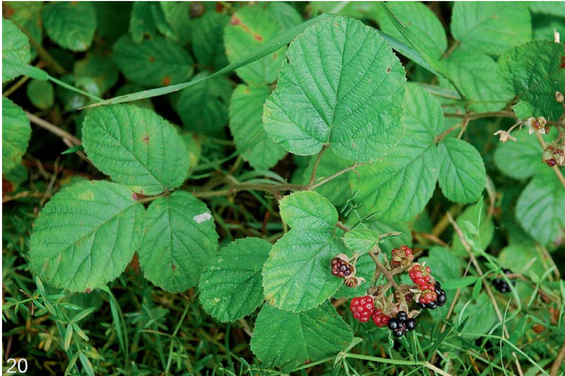
Abb. 20: Die Salzburger Brombeere ( Rubus salisburgensis ) bei Ölling/Tarsdorf – eine auf Grund ihrer rundlichen Blätter und ihres zartwüchsigen Erscheinungsbildes gut erkennbare Brombeere.