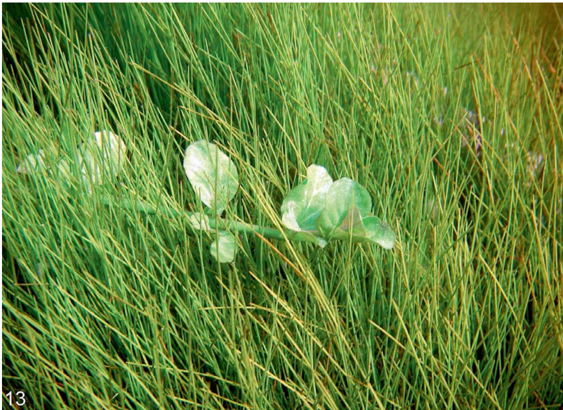
Abb. 13: In den Quellteichen und langsam strömenden Quellbächen an der Salzach und am Inn (bis knapp unterhalb der Salzachmündung) kommt die Nadel-Sumpfbirse flutend vor. Diese Form entwickelt meist keine Blüten bzw. Früchte. Bei den auf dem Unterwasserfoto abgebildeten Pflanzen handelt es sich um das Vorkommen in Überackern, wo E. acicularis in einer Wassertiefe von etwa einem halben Meter gemeinsam mit Mentha aquatica (siehe Foto), Ranunculus circinatus und Sparganium natans wächst.

Die Nadel-Sumpfbirse ist von den Anlandungen der Stauseen am unteren Inn bestens bekannt (vgl. ERLINGER 1985, CONRAD-BRAUNER 1994 und HOHLA & al. 2005). Bei den hier angeführten Funden handelt es sich jedoch um die sehr interessante Unterwassersippe, die bereits in HEGI (1909) als f. longicaulis bzw. var. fluitans angegeben wird. In den klaren Quellteichen und -bächen an Salzach und Inn bildet diese Art Unterwasserpflanzen aus bis zu 30 cm langen, flutenden, unfruchtbaren Stängeln (vgl. Abb. 13).