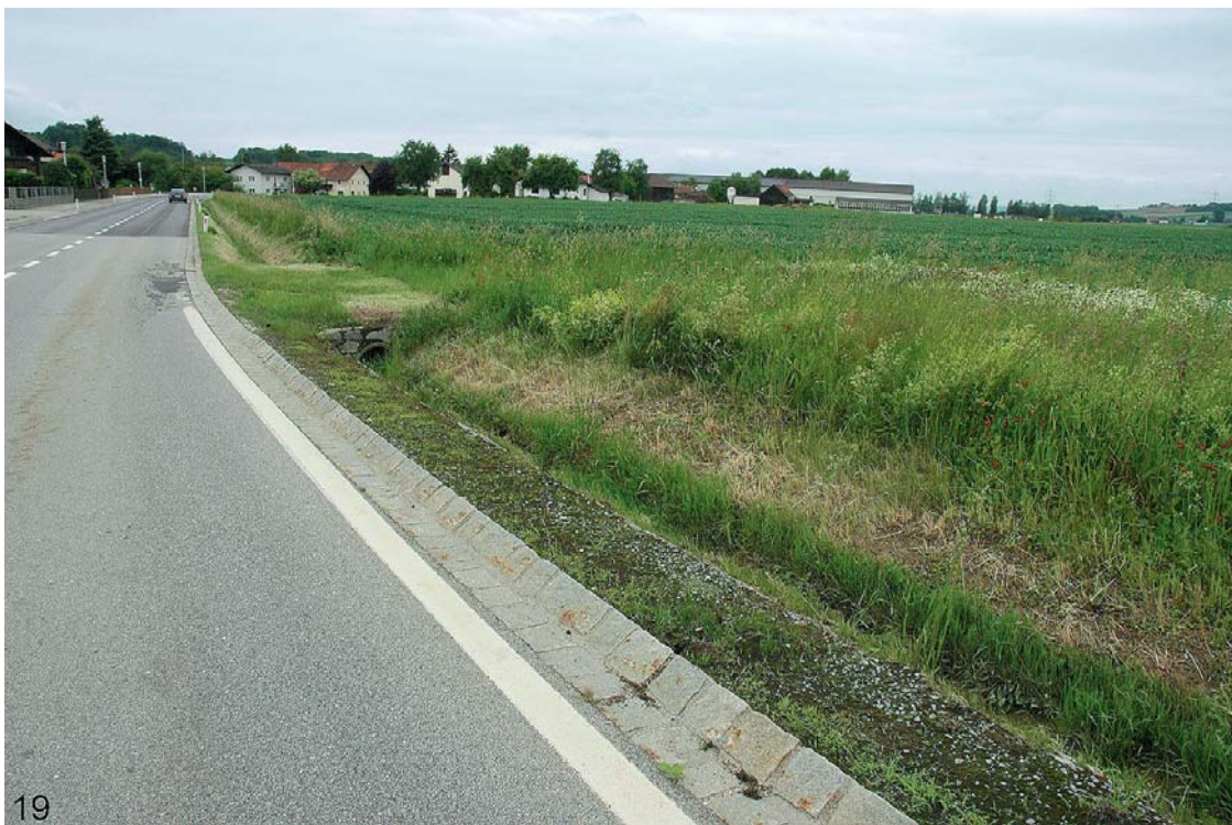
Abb. 18 und 19: Die Bläuliche Rispe ( Poa humilis ) am Straßenrand in Imolkam/Polling – durch Ansaatmischungen eingeschleppt – ein im Alpenvorland neophytisches Vorkommen. – Charakteristisch für diese Art sind die Blaugrüne Färbung der Pflanzen, die Bereifung der Ährchen, die Tatsache, dass meist nur zwei untere Rispenäste vorhanden sind und die einzelnen Blühtriebe. Außerdem sind die beiden Hüllspelzen meist etwa gleich und dreinervig (vgl. FISCHER & a. 2008).