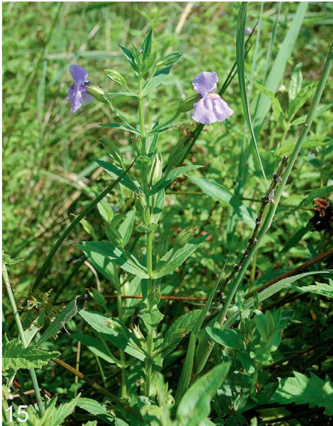
Abb. 15: Eine einzelne verwilderte Pflanze der Blauen Gauklerblume ( Mimulus ringens ) im Röhricht eines Wassergrabens auf den Anlandungen des Innstausees Obernberg-Egglfing.