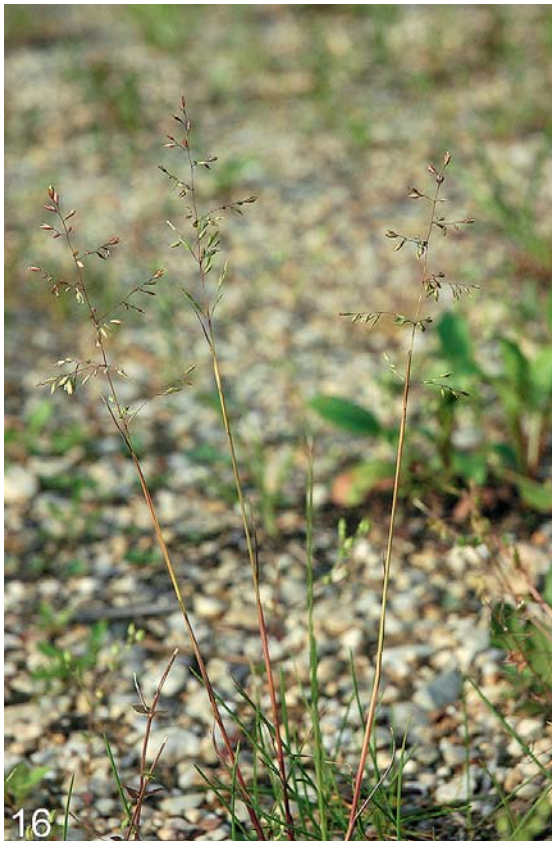
Abb. 16 und 17: Die aus Nordamerika stammende Bigelow-Rispe ( Poa bigelovii ) – gefunden nach Sanierungsarbeiten am Hochwasserchutzdamm bei Mühlheim am Inn – ziemlich sicher durch Ansaatmischungen eingeschleppt und nur unbeständig.