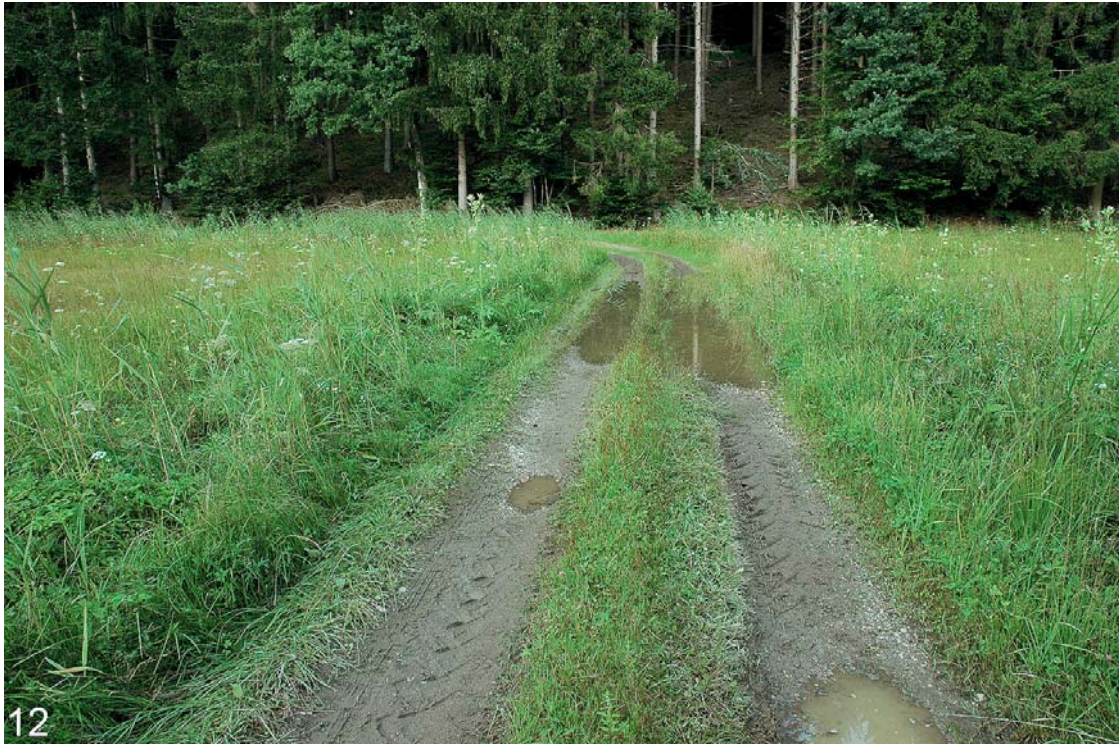
Abb. 11 und 12: Das Gelbe Zypergras ( Cyperus flavescens ) ist auf ein gewisses Maß an Störungen angewiesen, wie hier an diesem Weg durch eine Flachmoorwiese in Auerbach.

flavescens ist eine aus ökologischer Sicht interessante Pflanze, da sie scheinbar auf ein gewisses Maß an Störungen angewiesen ist. In Auerbach wächst sie auf einem schlammigen Fahrweg, der durch eine Flachmoorwiese führt. In den Spurrillen stehen Wasserpfützen. Gelegentlich durchfahrende Fahrzeuge halten den Boden offen. Am dichtesten wächst das Gelbe Zypergras dort an den Rändern der Spurrillen.