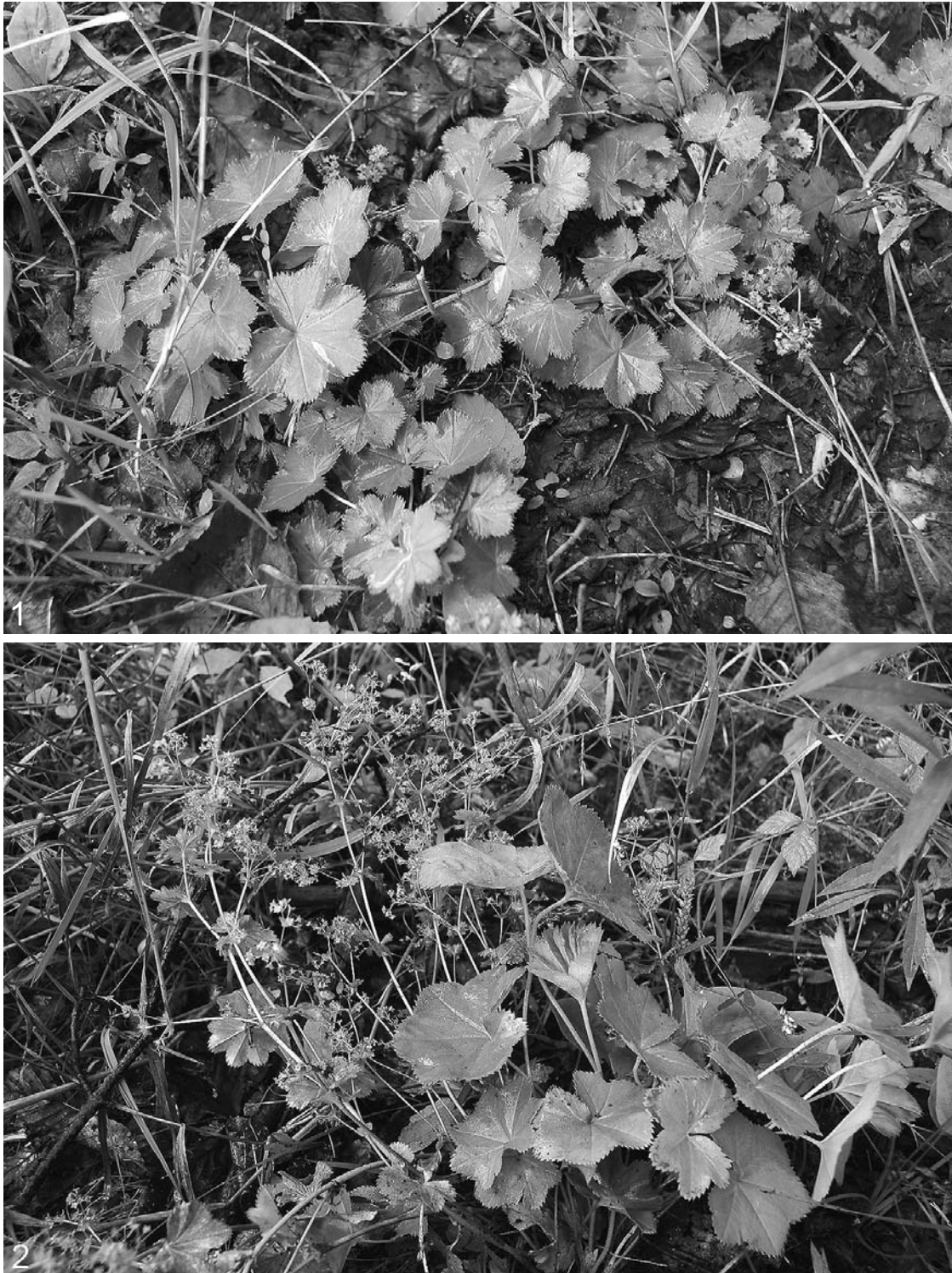
Abb. 1 und 2: Alchemilla impexa (oben) und A. obtusa (unten) als unbeständige Alpenschwemme auf dem feuchten Uferweg der Salzach nördlich von St. Radegund.