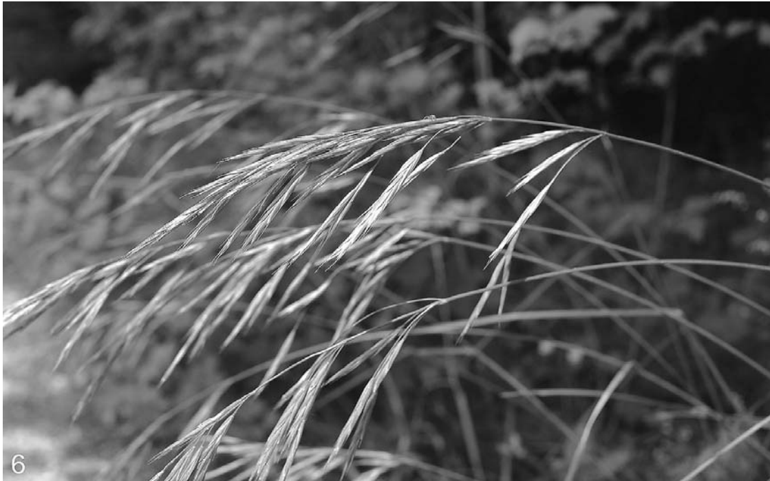
Abb. 6: Die aus Nordamerika stammende, durch Ansaatmischungen eingeschleppte Gräserart Bromus pumpellianus s. lat. an einem Waldrand am Hartberg bei Franking – habituell etwas an Bromus intermis oder Bromus erectus erinnernd.