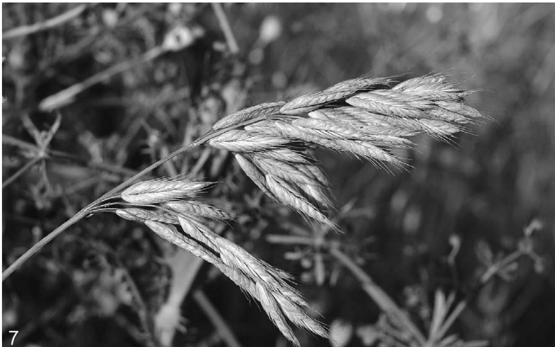
Abb. 7: Die in Österreich erstmals nachgewiesene Gräserhybride Bromus commutatus × hordeaceus unter den Eltern in einer ruderal getönten Wiese am Straßenrand in Au bei Ort im Innkreis.