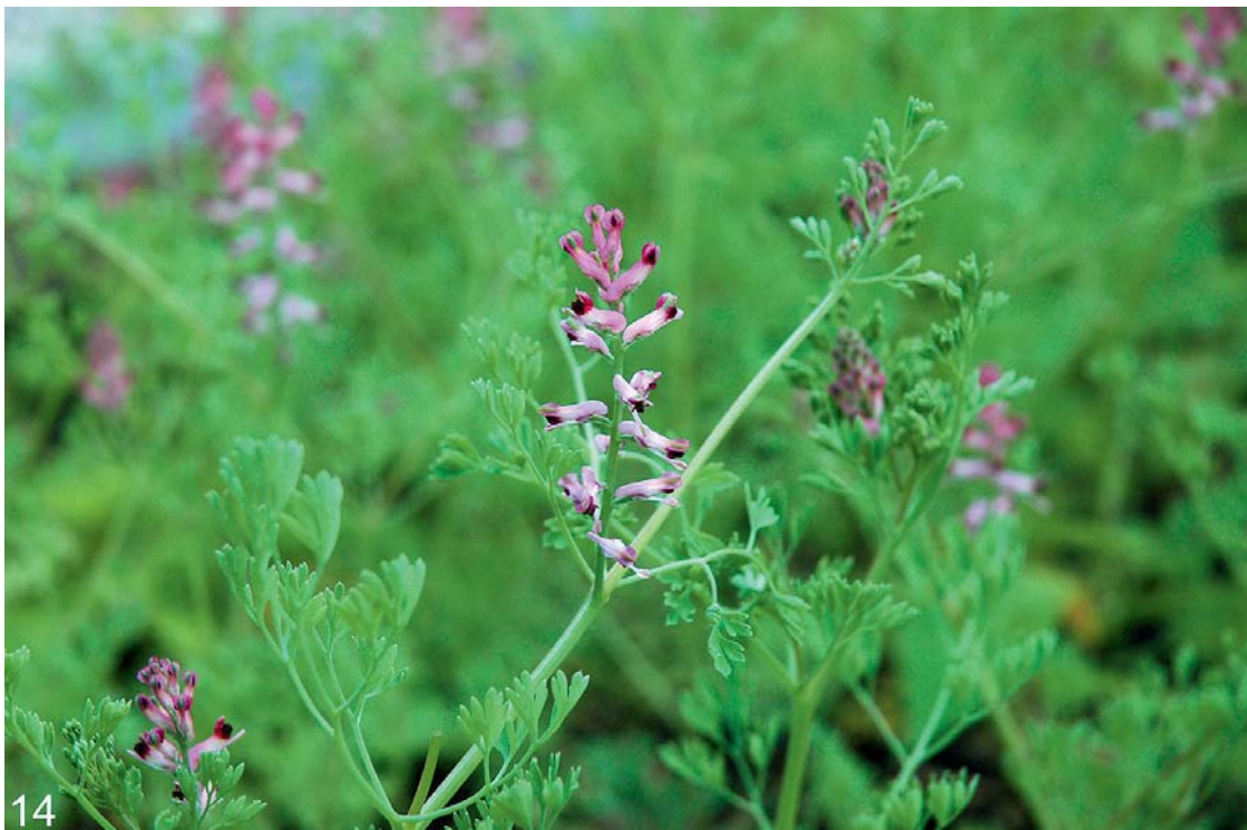
Abb. 14: Der Wenigblütige Echte Erdrauch ( Fumaria officinalis subsp. wirtgenii ) am Friedhof Braunau am Inn – mit der für diese Unterart typischen aufgelockerten Blütentraube und den im Vergleich zur subsp. officinalis etwas helleren Blüten.

Die bisherigen oberösterreichischen Funde dieser unbeständigen, neophytischen Sippe werden von HOHLA & al. (2009) zusammengefasst. Für das Innviertel ist der Fund der erste dieser Art (Abb. 14).