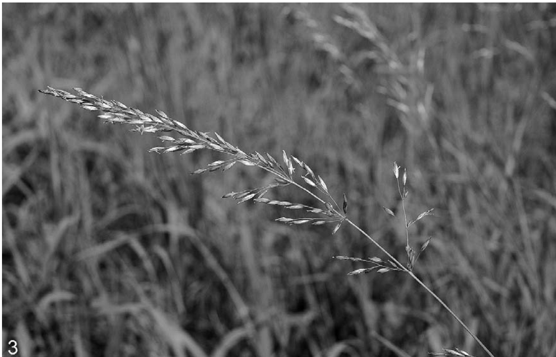
Abb. 3: Die grannenlose Form des Glatthafers ( Arrhenaterum elatius ), wie sie am renaturierten Unterlauf der Mattig angesät wurde.