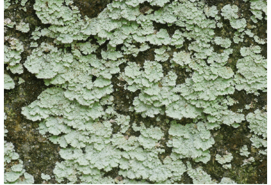
Abb. 3: Lepraria crassissima . Besiedelt regenge-schützte Felsüberhänge an sehr luftfeuchten Stand-orten in Bachschluchten der Böhmisches Masse. Standort: Rannatal; Foto: F. Berger.

Lit.: BERGER & TÜRK (1995); BERGER (1999, 2000); SCHINNINGER & TÜRK (2002); ABFALTER (2007); PRIEMETZHOFFER (2008).