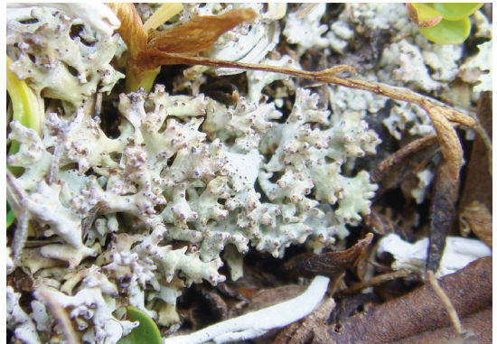
Abb. 2: Dactylina ramulosa . Diese Flechte arktisch-alpiner Windkantenheiden konnte erst vor wenigen Jahren im Dachsteingebiet nachgewiesen werden. Gjaidstein; Foto: F. Berger.