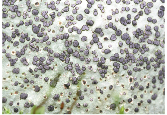
Abb. 4: Porpidia albocaerulescens . In den letzten 20 Jahren wurden große Fortschritte in der Erforschung der riparischen und amphibischen Silikatflechten im oberösterreichischen Granitgebiet erzielt. Diese Art wächst bachnahe an Felsen in kollinen Schluchten.