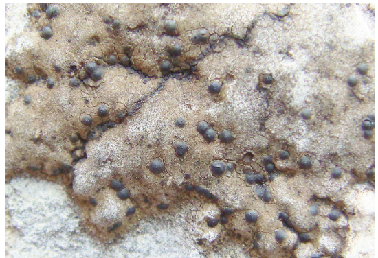
Abb. 6: Verrucaria fischeri . Eine der vielen kernfrüchtigen Arten auf Kalk in der subalpinen Zone.