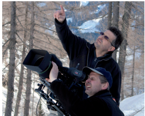
Ein Kamerateam des ORF begleitete das Gasteiner Paar ein halbes Jahr lang

Über die leider wiederum nicht erfolgreiche Brut des Gasteiner Paares wird noch ausführlich auf der nächsten Seite berichtet. Ende 2008 konnte mehrmals ein etwa