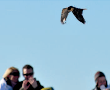
Mancher Bartgeier blieb den Winter über wohl unentdeckt

Der Winter verlief außergewöhnlich ruhig in Österreich. Geht man rein nach der Anzahl der Meldungen, blieben viele Regionen über Wochen regelrecht "bartgeierleer". Auch fix etablierte Altvögel schienen völlig von der Bildfläche ver-