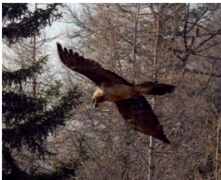
Seit längerem wird in Osttirol nur das Männchen des letztjährigen Paares bestätigt

diese Zeit auch mehrere Sichtungen eines vier- bis fünfjährigen Vogels aus dem Raum Prägraten vor. Seit Jahresbeginn scheint der Osttiroler Altvogel immer weitere Kreise zu ziehen und konnte nur mehr unregelmäßig bestätigt werden. Im Jänner wurde noch einmal Rurese (Rauris 2008) in Kals beobachtet. Von Interesse war die wiederholte Sichtung von zwei