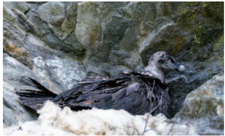
Jungvogel im Horst

Wieviele Bruten im Freiland 2009 erfolgreich sein werden, ist noch nicht ganz sicher, aber die Zeichen stehen zu Redaktionsschluss dieser Ausgabe gut. Allen voran liegt dieses Jahr erneut Frankreich mit fünf derzeit erfolgsversprechenden Bruten, gefolgt von der Schweiz und