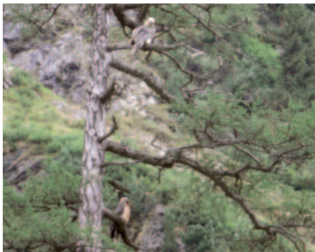
Im Spätherbst flammte nochmals Hoffnung für ein Paar in Osttirol auf

Das Osttiroler Paar scheint seit dem Spätfrühling 2008 wieder Geschichte. Weibchen Nicola (Rauris 1991) verschwand von einem Tag auf den anderen und konnte auch in anderen Regionen, so auch in ihren ursprünglichen Kerngebiete-