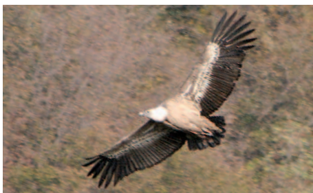
Gänsegeier im Anflug

In den nächsten Wochen werden wieder vermehrt Gänsegeier als Sommergäste nach Österreich kommen. Da in den letzten Jahren eine großräumigere Verteilung dieser Vögel zu bemerken war, soll auch heuer wieder versucht werden, ihre Streifgebiete und Routen so gut wie möglich zu erfassen. Aus diesem Grund ergeht die Bitte an Sie, liebe LeserInnen, auch Gänsegeiersichtungen an die, auf der letz-