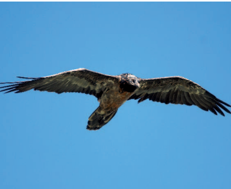
Hubertus 2 scheint das Männchen im Paar östlich der Ankogelgruppe zu sein

In Kärnten wurden in den letzten Wochen zumindest sechs verschiedene Bartgeier nachgewiesen. Regelmäßig konnte das Paar in der östlichen Ankogelgruppe gesichtet werden. Ein ausgewerteter Federfund bestätigte Hubertus 2 (Kals 2004) als männliches Tier, was wahrscheinlich gleichzeitig auch erklärt, warum das junge Paar nicht zur Brut