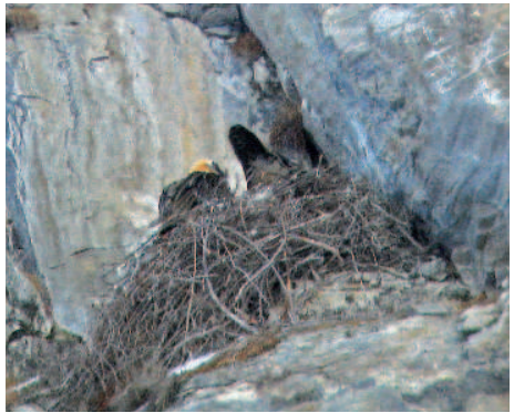
Auch 2009 wurde leider nichts aus der erhofften Bartgeierbrut in Österreich

Um welche beiden Tiere es sich dabei in der Hauptbrutsaison gehandelt haben könnte, ist völlig unklar. Anfang März wurde noch ein Bartgeier im deutschen Teil des Hagengebirges von einem Tourengeher gesichtet. Das markierte und besenderte Männchen Blick (CH 2007) hielt sich im März über mehrere Wochen immer wieder im Allgäu auf, danach wurde es ruhiger.