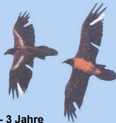
2 - 3 Jahre Markierungsreste u. Lücken