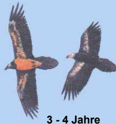
3 - 4 Jahre Kopf noch dunkel