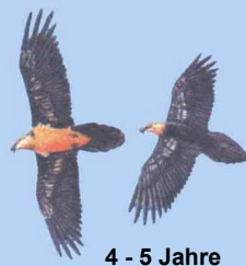
4 - 5 Jahre helle Kopffärbung