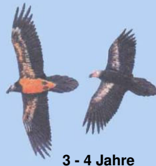
3 - 4 Jahre Kopf noch dunkel