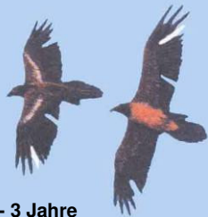
2 - 3 Jahre Markierungsreste u. Lücken