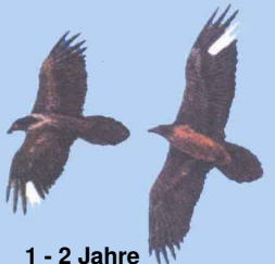
1 - 2 Jahre Markierungen deutlich

Grafiken: El Quebrantahuesos en los Pireneos (R. Heredia y B. Heredia); Ministerio de Agricultura Pesca y Alimentación. Publicaciones del Instituto Nacional para la Conservación de la Naturaleza, 1991