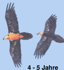
4 - 5 Jahre helle Kopffärbung