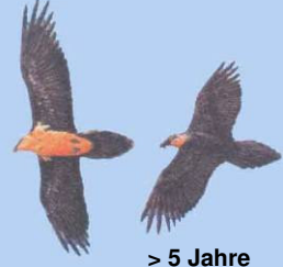
> 5 Jahre Kopf gelblich/rötlich