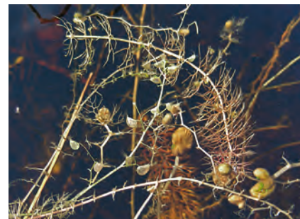
Abb. 10 (oben): Utricularia bremsii wurde in der Drumlinlandschaft 2012 und 2015 im Blühzustand in einem alten, mesotrophen Torfstich nachgewiesen. Teilgebiet A, 14. 7. 2015.