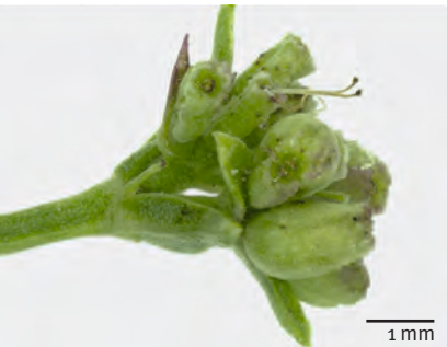
Abb. 8: Asperula neilreichii : Wenig warzige bis glatte Früchte.