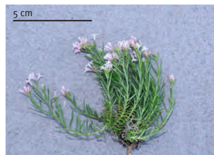
Abb. 5: Asperula neilreichii (Rüttelhorn SO): Untere Stängelblätter zur Blütezeit erhalten, verkehrt-eiförmig, zurückgekrümmt. Mittlere und obere Stängelblätter meist so lang oder länger als die Stängelglieder.

Es ist sehr wahrscheinlich, dass falsch bestimmte Belege hier und dort in einem Herbarium schlummern. Weniger wahrscheinlich ist es, dass korrekt bestimmte Belege den aufmerksamen Augen der Schweizer Botaniker entgangen sind. Letzteres kann aber trotzdem nicht ausgeschlossen werden. Es wurden nämlich in den letzten Jahren mindestens zwei solche Fälle bekannt, namentlich Aconitum napellus subsp. tauricum (Wulfen) Gáyer (BORNAND 2012) und Myosotis minutiflora Boiss. & Reut. (JUILLERAT 2015).