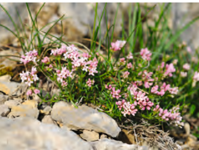
Abb. 3: Asperula neilreichii , an Felsfuss bei der Hasenmatt (SO), 17. 6. 2015