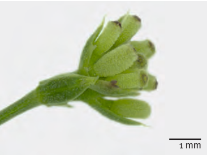
Abb. 7: Asperula cynanchica : Deutlich warzige Früchte.