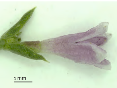
Abb. 2: Asperula neilreichii (Hasenmatt, Kt. SO). Krone rosa, aussen glatt.