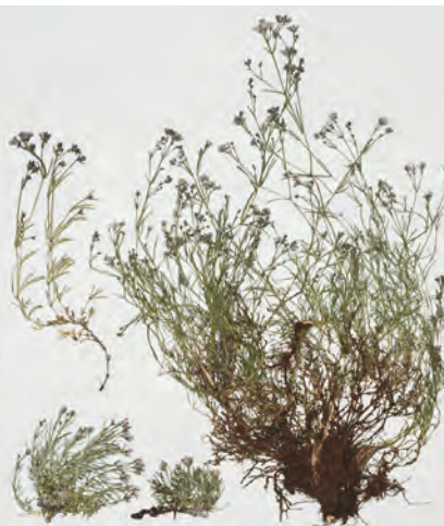
Abb. 4: Unterschiede im Habitus zwischen Asperula cynanchica und A. neilreichii . Rechts A. cynanchica : Welschenrohr (SO), 22. 6. 2015, 755 m, Mesobromion. Oben links die alpine Form von A. cynanchica : Pilatus (OW), 28. 6. 2015, 1875 m, Caricion firmæ. Unten links A. neilreichii : Rüttelhorn (SO), 17. 6. 2015, 1130 m, Potentillion caulescentis.