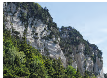
Abb. 1: Hasenmatt (Kt. SO), Asperula neilreichii besiedelt hier kühle Felswände und die Schuttfloren am Fuss derselben. 1. 7. 2011