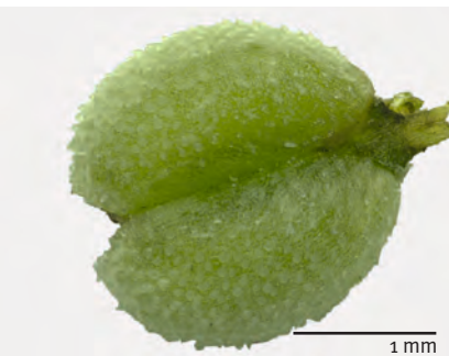
Abb. 9: Asperula cynanchica : Detailaufnahme einer Frucht mit den beiden warzigen Teilfrüchten.