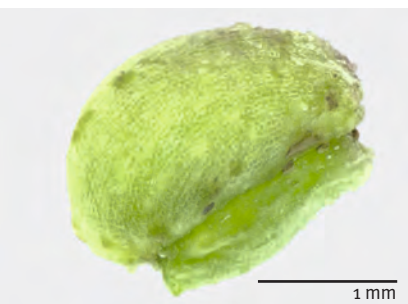
Abb. 10: Asperula neilreichii : Detailaufnahme einer Frucht mit den beiden glatten Teilfrüchten.