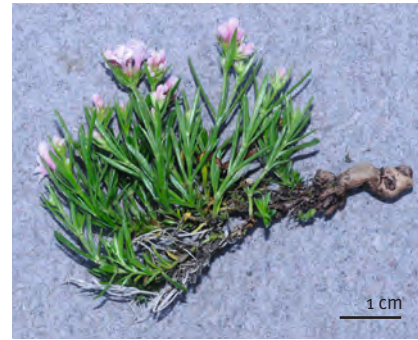
Abb. 11: Asperula neilreichii bildet eine ziemlich dicke verholzte Wurzel (3–5 mm).

In Anbetracht der Ansiedlung in den Waadtländer Vor-alpen bei Leysin kann die Frage aufgeworfen werden, ob die Art im Jura auch wirklich autochthon ist. Die Wahrscheinlichkeit einer Ansiedlung durch den Menschen oder eine Verwilderung aus einem botanischen Garten erscheint jedoch als