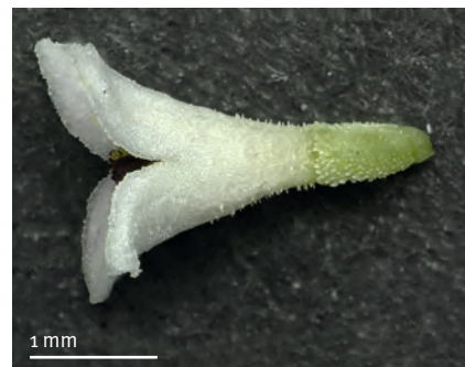
Abb. 6: Asperula cynanchica (Gorges de Court BE). Krone aussen meist raukörnig.