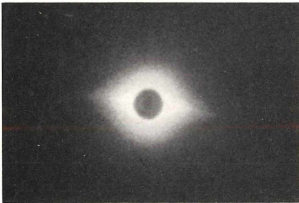
Fig. 3 Korona bei der Finsternis 1954 (Sonnenfleckenminimum)