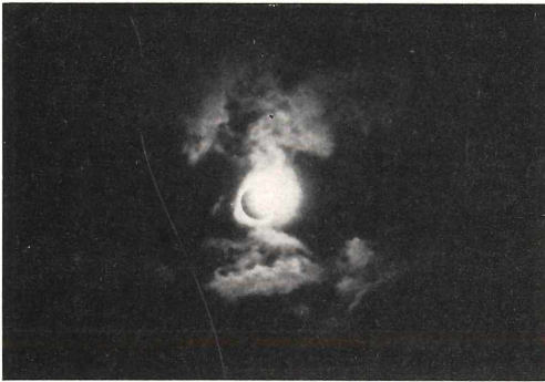
Fig. 2 End-Kontakt, links Korona, rechts überstrahlter Sonnenrand