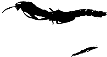
Abb. 1. Die Imagines von Xenopelopia sind beim Schlüpfen nicht in der Lage, den Liparolfilm zu durchdringen. Sie bleiben mit verklebten Flügeln teilweise in der Puppenhaut hängen und ersticken in dieser Lage.

Die Untersuchung der Atemhörnchen ergab, daß sie nicht ein oben offenes Röhrchen darstellen, sondern durch Fasern verschlossen sind (Abb. 2). Diese Fasern bilden ein dreidimensionales Netzwerk, in dem sich drei verschiedene Anordnungsebenen zeigen lassen. Besonders deutlich ist in der obersten Ebene zu sehen, daß meist vier Fasern kuppelförmig miteinander verbunden sind (Abb. 3).