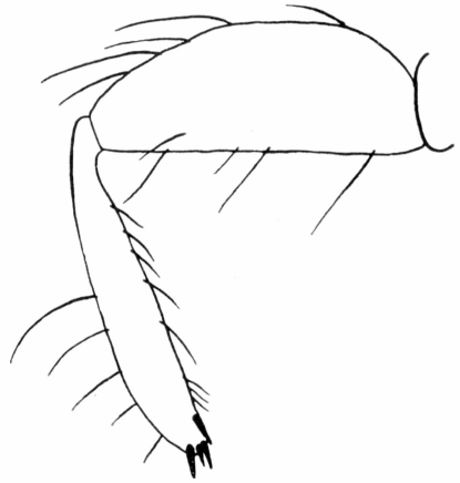
Fig. 3. Eomenacanthus brachygaster Giebel, ♀. Linker Hinterfemur mit Tibia (von oben)

lebenden Eomenacanthus cornutus . Dies scheint mir ein weiteres Indiz für die Verwandtschaft der Steißhühner mit den echten Hühnervögeln zu sein, für die ich ja auf Grund der Mallophagenbefunde