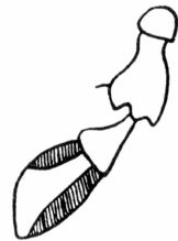
Fig. 2. Eomenacanthus brachygaster Giebel, ♀. Linker Fühler (dorsal)

der Chaetotaxie keine besonderen Merkmale hervortreten, besagt zunächst nicht viel, da die Menacanthinae in dieser Hinsicht einen allgemein ziemlich einheitlichen Körperbau zeigen. Als ausgesprochen primitive Merkmale werte ich dagegen den verhältnismäßig vorgezogenen (nicht besonders breiten) Kopf (der in diesem Punkt auch dem Körperbau entspricht und von dem meist breitköpfigen Menacanthinae