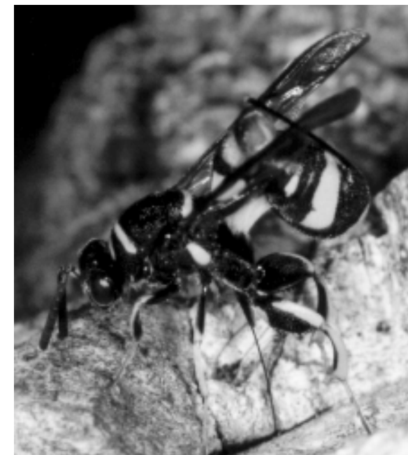
Ein ♀ der Erzwespe Leucospis dorsigera bei der Eiablage. Sie legt Ihre Eier durch den Legebohrer in Nester von Osmia - und Megachile -Arten. Der Bohrer der auffällig gelb-schwarz gezeichneten Art entspringt zwischen den Hinterhüften und wird in Ruhe in einer Scheide über dem Abdomen getragen.