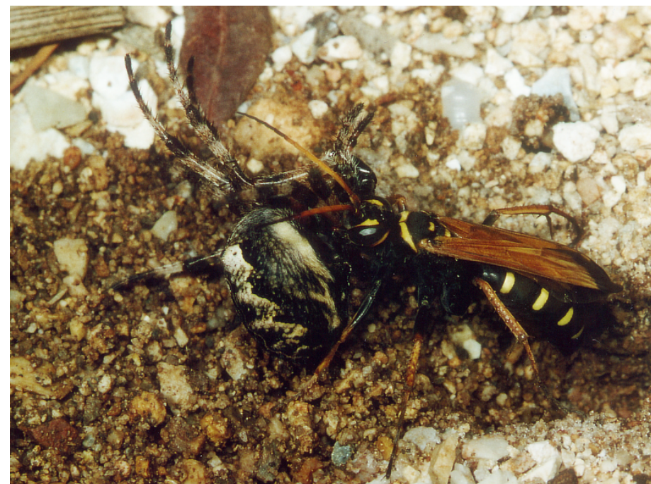
Batozonellus lacerticida ♀ trägt eine Kreuzspinne ins Nest (rechts) ein (SW Griechenland, 26.06.1994).

zitternd, einem mechanischen Verdichtungsgeräusch gleich, das Material mit der Abdomenspitze festklopfte. Dabei war ein weich vibrierendes Geräusch zu vernehmen. Die Frequenz war so hoch, dass die Wespe dabei „unscharf“ aussah (ca. 50 Hz), die Amplitude betrug ca. 2-3 mm, die Länge der Wespe ca. 20 mm. Zuletzt biss die Wespe mit den Mandibeln frisches Material vom Lochrand los und stampfte es fest, nachdem sie den übrig gebliebenen Rest (Brutkammervolumen!) „in alle Winde“ gefegt hatte. Beim Ausnagen legte sie einen zusätzlichen kurzen Gang an, in den sie um ca. 21:00 Uhr rückwärts einschlüpfte (Schlafbau?). Oder sollte dieser kurze Gang zur Irreführung potentieller Nesträuber dienen? Insgesamt muss die Sequenz vom Erbeu-