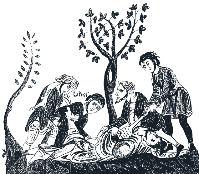
Abbildung 7c: Straßenräuber überfallen Pilger (Herrad von Landsberg, 12. Jahrhundert)

Auf Wegen und Straßen spielt sich in den 50ern auch die Freizeit ab. Viele Spiele von Kindern und Jugendlichen sind wegeorientiert: das schon aus der Antike stammende Hüpfspiel „Himmel und Hölle“, zu dem auch Steine vom Wegrand benötigt werden; Murmeln, für die die ohnehin vorhandenen Unebenheiten der Straßenoberfläche zu Kuhlen vertieft werden; Ballspiele mit den merkwürdigen Namen 10er- oder 12er-Probe an Scheunenwänden. Das schönste Straßenspiel der Kinder und Jugendlichen jedoch findet im Winter statt, wenn Schnee liegt. Dann sausen sie auf ihren Schlitten die Hauptstraße des Dorfes drei Kilometer von der Spitze des Berges ins Tal hin-