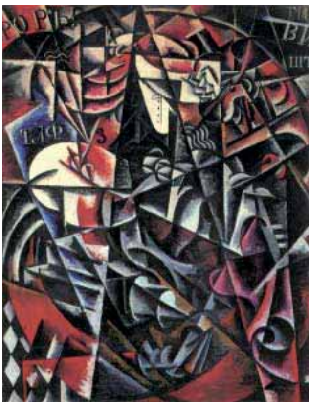
Abbildung 2: „Traveling Woman“ (Ljubow Popova, 1915)

Following a series of general reflections concerning the significance of paths and landscapes with respect to human life, the contribution deals with the changes that have taken place regarding paths in the last 50 years and observes thereby the concrete changes in the paths within the rural life context. The object is to try to understand the loss of paths, special places and dynamism through „total mobilization“ (Paul Virilio) in order to make a plea for a revitalization of paths and a new walking culture, not only between villages and regions but also in the villages themselves.