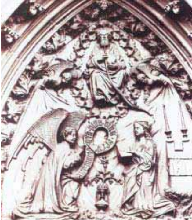
Abbildung 9: Ungewöhnliche „Erfahrungen“ (Darstellung an der Marienkapelle am Markt in Würzburg) (s. S. 13)

ten zu bewegen. Damit werden wiederum Begegnungen und Vernetzungen gefördert, die neue Formen von Multikulturalität gewissermaßen fußläufig schaffen.