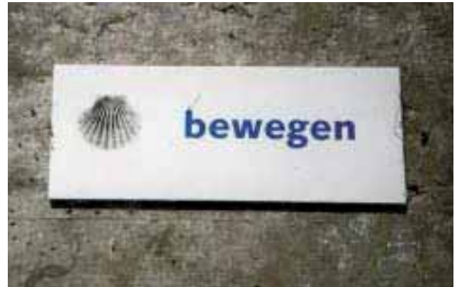
Abbildung 8: Be-wegen. Wegweiser am Jakobsweg in der Schweiz

„Zu den Kindern hat man keine Beziehungen mehr, nicht einmal mehr zu den Nachbarskindern. Die grüßen nicht ein-