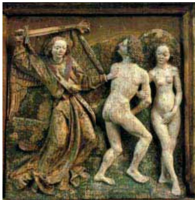
Abbildung 6: Adam und Eva – noch ohne Weg und Steg; Vertreibung aus dem Paradies (Reliefdetail aus Lindenholz von der Rosenkranztafel in der Nürnberger Frauenkirche; Werkstatt des Veit Stoß, um 1518/19)

Die reichhaltige Wegmetaphorik zur Beschreibung von grundlegenden Befindlichkeiten konserviert eine Vergangenheit, in der die Fortbewegung noch nicht so geschwind war, dass sie Räume zum Verschwinden gebracht hätte. Erst im 19. Jahrhundert wurde ein neues Tempo angeschlagen. In der modernen, geschwindigkeitsbeherrschten Gesellschaft beschleunigten sich selbst die Begriffe: „ Fahren “ wird fortan auf die Bewegung mit schnellen Vehikeln, Wagen, Schiff, Eisenbahn und Auto eingengt. Der Begriff „ unentwegt “ avanciert im letzten Drittel des 19. Jahrhunderts, zeitgleich mit dem Nervositätsdiskurs (vgl. RADKAU 1998), zum neuen Modewort. Die Unterscheidung zwischen Weg und Straße gewinnt an Kontur: War Straße ursprünglich nur der mit Steinen befestigte und planmäßig ausgebaute Weg, die Heerstraße, die der Eroberung