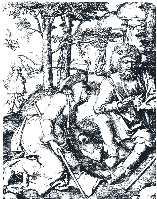
Abbildung 7b: Pilgerpaar an der Landstraße (Kupferstich von Lucas van Leyden, um 1508)

„Auf Arbeit“ gehen diejenigen, deren Arbeitsplatz außerhalb des Dorfes und seiner Flur liegen. Bauern gehen nicht auf Arbeit, sondern aufs Feld oder in den Stall. Dabei zeichnen sie Spuren der Dorfgeschichte nach. Ob ein Dorf vor vielen Jahrhunderten als Straßen- oder Haufendorf, als Anger- oder als Hufendorf angelegt wurde, dokumentiert bis in die Gegenwart ein jeweils typischer Straßenverlauf. Wege und Raine markieren die Besitzverhältnisse, und der Slalom der Bauern, Arbeiter und Handwerker zu ihren Arbeits-Plätzen zeichnet den Dorfkataster nach. Daneben gibt es auch Mischformen, etwa halböffentliche Abkürzungen über Privatgrundstücke. Für Zwecke, die dörflichem Herkommen oder Brauchtum entsprechen, wie Kirchgang oder Schulweg, oder aber als Gegenseitigkeitsverpflichtungen zwischen Nachbarschaften und in Dorfvierteln ist die Nutzung solcher informeller Wege mitunter