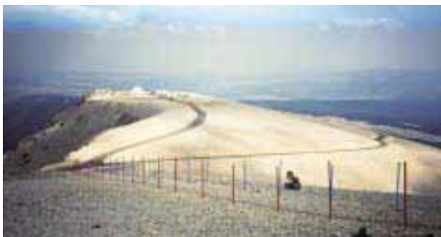
Abbildung 5: Gipfelweg auf dem Mont Ventoux (Foto: Inhetveen; siehe Literaturverzeichnis: INHETVEEN 2004)

wie sich ihm beim Schauen der Landschaft eine neue Welt-Sicht eröffnete, ein Bewusstwerden der Landschaft als etwas von ihm Getrenntes, das ihn zutiefst erschreckte (vgl. INHETVEEN 2004).