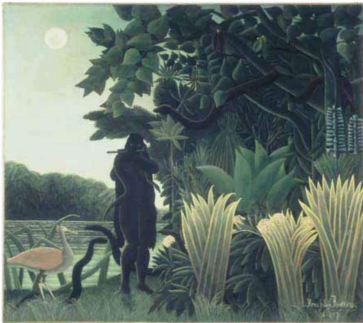
Abbildung 2: „La charmeuse de serpents“ („Die Schlangenbeschwörerin“), Henri Rousseau; Öl auf Leinwand, 169 x 189,5 cm (Paris 1907)

heben, sondern mit ihr eins zu werden, aber als das größte Naturwesen unter allen, als absoluter Sieger. Der Kampf (sowohl mit den Naturgewalten als auch mit sich selbst) wäre somit nur Mittel zum Zweck, der im Erleben eines besonderen Bewusstseinszustandes, eines Eins-Seins mit dem Weltall liegt, der aber doch nicht einfach ein Aufgehen in diesem ist.