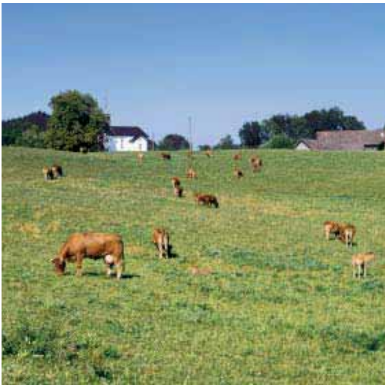
Abbildung 2: Mutterkuhhaltung (im Allgäu)

Als Erfolgsgröße wird die Arbeitsverwertung betrachtet (siehe Kapitel 3.1). Sie kann somit