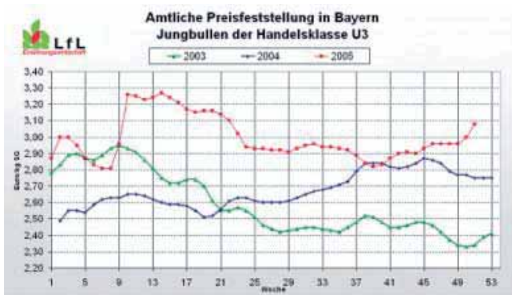
Abbildung 5: Amtliche Preisfeststellung in Bayern – Jungbullen der Handelsklasse U3 (BayStMLF 2006)

Abbildung 4 zeigt die Förderansprüche bei den vier Verfahren im Vergleich. Mutterkuhhaltung ist das Verfahren mit der besten Wirtschaftlichkeit, gefolgt von der Koppelschafhaltung. Die praktisch nicht vorhandenen Verfahren der Ziegenhaltung und der Hüteschafhaltung in kleinen Beständen sind deutlich teurer.