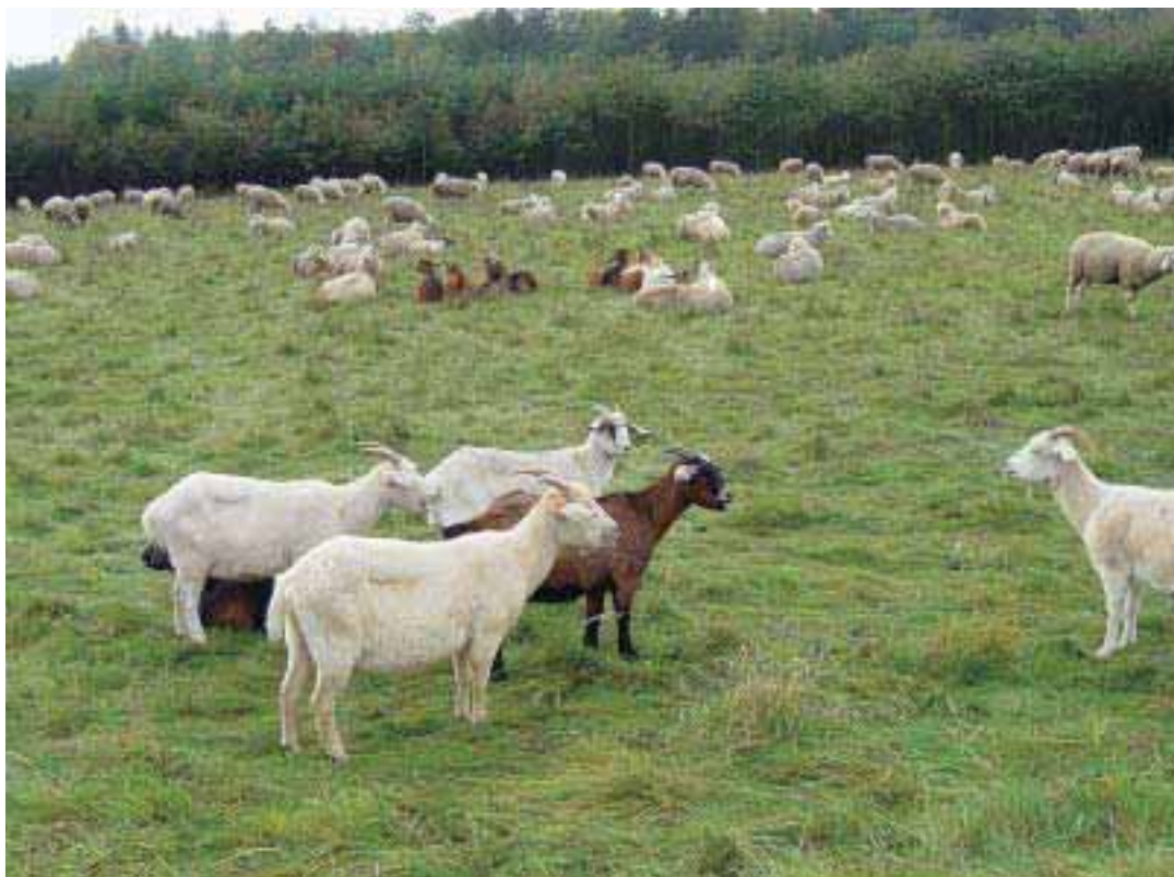
Abbildung 3: Beweidung mit Ziegen/Schafen