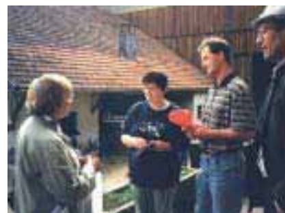
Bild 2: Besuch von tschechischen Landwirten bei bayerischen Biobauern in Kötzing. Die Tschechen bewunderten die Vielseitigkeit, die Arbeitsfreude und die Existenzfähigkeit von kleinen bayerischen Familienbetrieben. (Kroupova, Plötz, Maly, 1999)

Dies entsprach genau unserer Vision einer europäischen Vereinigung über die deutsch-tschechische Grenze hinweg. Voraussetzungen für die erfolgreiche Umsetzung unserer Vorstellungen zu neuen grenzüberschreitenden Wegen im bayerisch-tschechischen Verhältnis waren die Gunst der Stunde und die Bereitschaft, aufeinander einzugehen.