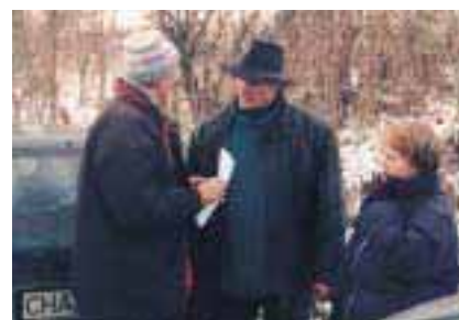
Bild 4: Treffen von Projektleitern an der Grenze in St. Katharina (Kreis Klatovy) zur Erschließung des Böhmerwaldes für einen grenzüberschreitenden Agrartourismus (Göndör, Maly 2000). Ein großes Potential liegt brach. Kooperation ist besser als Konkurrenz.

Als erstes schlug ich dem Bayerischen Landwirtschaftsministerium landwirtschaftliche INTERREG-Projekte vor, worauf ich zur Projektentwicklung beauftragt wurde. Dies hieß zunächst, die Landwirtschaft im bayerisch-tschechischen Grenzland in