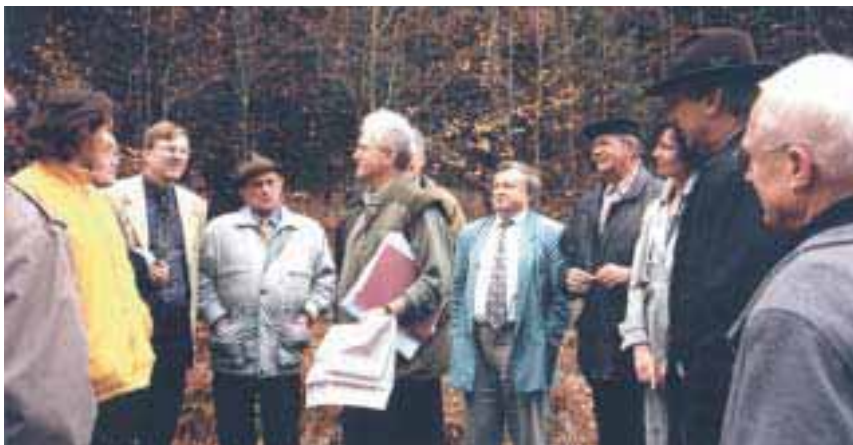
Bild 6: Grenzüberschreitender Gewässerschutz im Stadtwald Domazlice (Berg Cervkov im Trinkwasserschutzgebiet für die Stadt Waldmünchen). Der böhmische Wald wird hier bestens bewirtschaftet und das Trinkwasser für Bayern geschützt.

logischen Landbaus in der CR organisiert hatte, war nun nach einem Regierungswechsel selbst Vizeminister geworden. Ich schrieb ihm einen Brief, gratulierte ihm, schlug ihm die Zusammenarbeit zur Entwicklung von agrarökologischen INTERREG-Projekten vor und pilgerte an die Moldau ins tschechische Landwirtschaftsministerium. Mein junger Bekannter und Geistesverwandter, der Vizeminister, saß in seinem Büro über der Moldau vor zwei Computern und sprach Englisch. Er ging in Brüssel ein und aus, kannte Europa, war aufgeschlossen und kooperativ. Auch er wollte Projekte entwickeln, entwickelte meine Ideen weiter und schickte seine Mitarbeiter, um die Kooperation voran zu bringen.