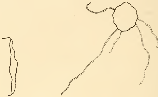
Abb. 1. Aerotropische Krümmungen der Wurzelhaare von Lunularia ; links Kapillarenöffnung.

waren, verschlossen und weiter im Thermostaten belassen. Schon nach 24 Stunden waren deutliche aerotropische Krümmungen wahrnehmbar, sowohl an den in der Nähe der Kapillarenöffnung (2—4 mm) gelegenen Brutknospen (Abb. 1), als auch an entfernter (20, 23, 34 mm) befindlichen. Am deutlichsten waren sie an den in gerader Richtung vor der Kapillare liegenden Brutknospen. Auf einem Objektträger waren nach einer Woche von 30 Rhizoiden 18 (60%), auf einem zweiten von 24 Rhizoiden 15 (62%) positiv aerotropisch gekrümmt. Als Kontrolle diente eine allseitig luftdicht verschlossene Kammer ohne hindurchgehende Kapillare; in dieser