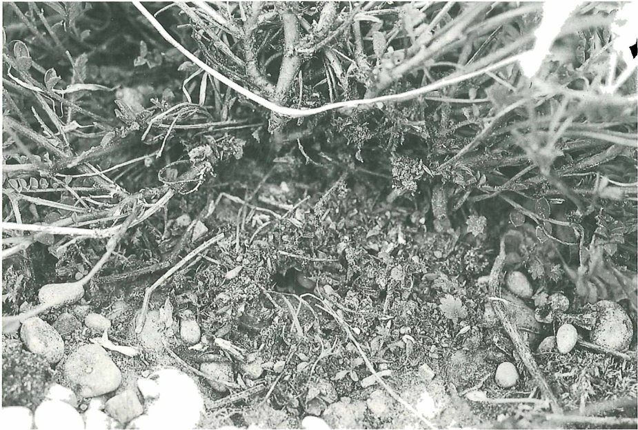
„Stall“ einer L. coridon Raupe an einem Ameisennesteingang von T. caespitum (an der Seite etwas geöffnet (Weiher-Heide, 1.6.98))

„Erfolgsrezeptes“ (MASCHWITZ & FIEDLER 1988) eine einmalige Artenvielfalt unter den Tagfaltern erreicht: circa 6000 Arten weltweit (MASCHWITZ & FIEDLER 1988). Dieser Erfolg ist, soll er fortbestehen, jedoch an intakte Ökosysteme gebunden.