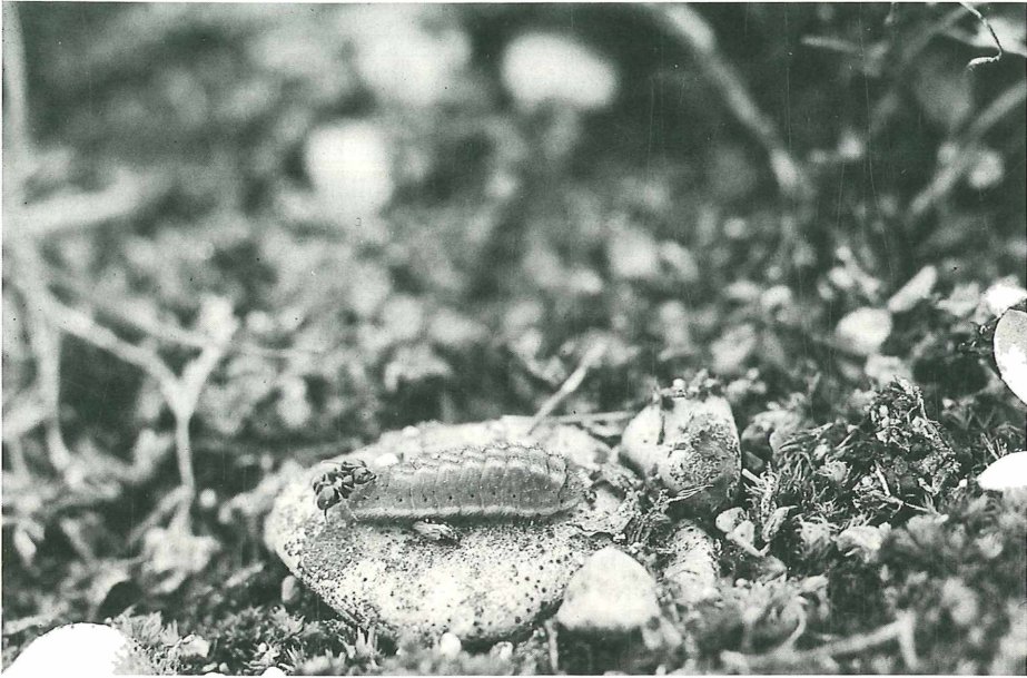
Lasius niger -Ameisen saugen an Lysandra coridon -Raupen (Hurlacher Heide, 15.5.99)

hing von der Ameisenart, der Temperatur und wohl auch dem Entwicklungsstadium der Raupen ab. Einige Ameisen ließen sich bei ihren Interaktionen mit den Raupen nicht stören, andere verschwanden für längere Zeit (bis über 30 Min.) unter Steinen. Manchmal ließen sich Ameisen mit Raupen geradezu „ködern“, d. h. sie suchten die Raupen auch dann auf, wenn diese auf Steine gelegt wurden.