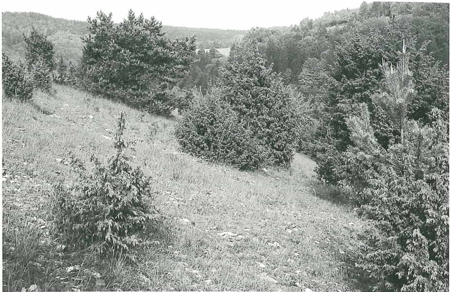
Larval-Habitat von Lysandra bellargus und Lysandra coridon: Heide im Jura (bei Solnhofen), flachgründig, steinig und schütterer Bewuchs

wie in dazugehörenden Saumstrukturen anzutreffen. Die Raupenfunde stammen dagegen ausschließlich aus Arealen mit lückiger Vegetation wie Randbereichen von Felsbändern und Lesesteinhaufen, Steintriften, aufgelassenen Steinbrüchen, kiesigen Rohbodenstandorten, Bodenverletzungen durch Trittsuren von Weidetieren und durch Trampelpfade. Die Bindung an sehr trocken-warme Mikrohabitate scheint bei L. bellargus ausgeprägter als bei L. coridon zu sein. Raupen von L. coridon entdeckte ich, wenn auch seltener, in dichter bewachsenen Arealen, allerdings nur dann, wenn diese südlich vor Fels- oder Strauchformationen (vorwiegend Wacholder) lagen. 2 In eutrophierten und verfilzten Grasbereichen fand ich ebenso wie auf Fels oder reinem Kies nie Raupen – selbst dann nicht, wenn hier die Wirtspflanze, der Hufeisenklee ( Hippocrepis comosa ), üppig wuchs.