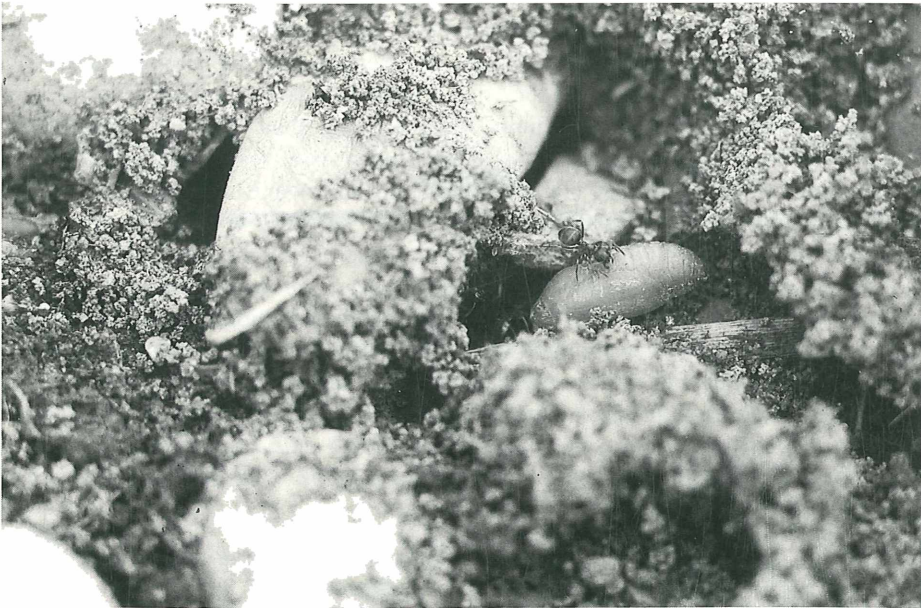
Lysandra coridon -Puppe in Ameisengang ( Lasius niger , Sander Heide, 26.6.98)