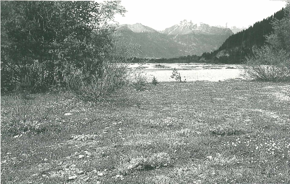
Larval-Habitat von Lysandra coridon inmitten dichter Populationen der Ameise Formica selysi: Oberes Lechtal (Tirol), 20.5.2000, vgl. Text 8.2