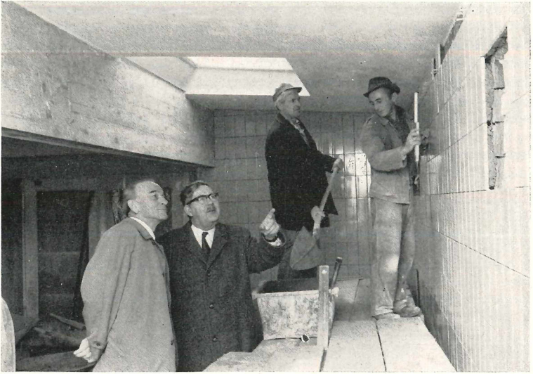
Herr Oberbürgermeister Wolfgang Pepper besichtigt den Erweiterungsbau am Vogelhaus des Augsburger Tiergartens. Oben: die neuen Volieren im Ostanbau, Unten: im neuen Futter- und Eingewöhnungsraum im Westanbau.