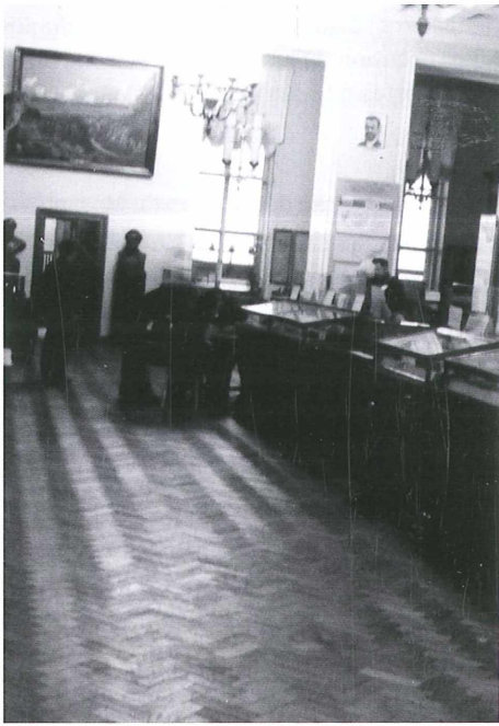
Abb. 2 Im Naturhistorischen Museum der Universität Moskau.