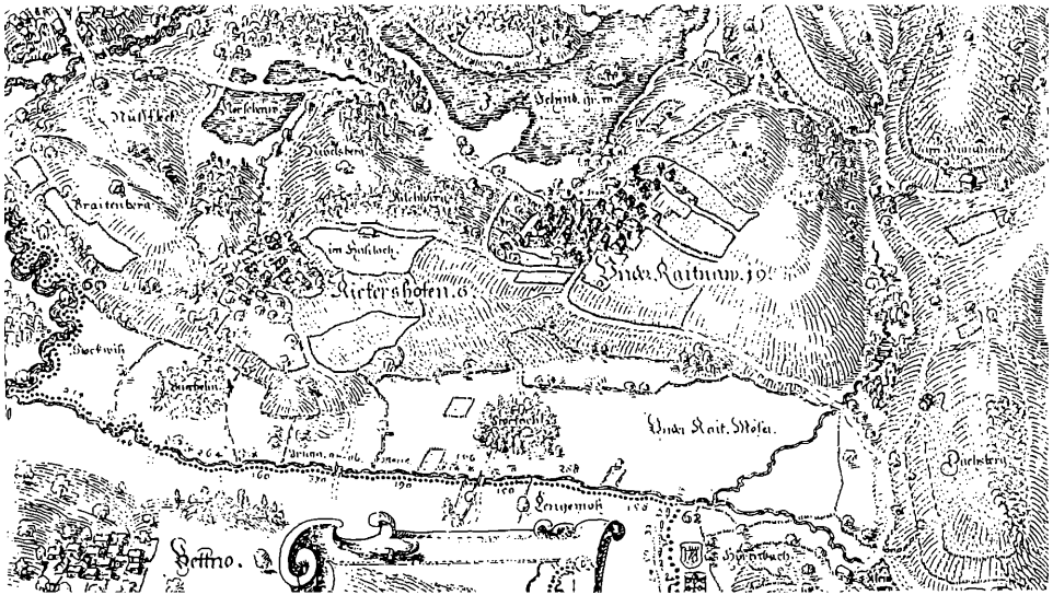
Abb.2: Unterreitnauer Moos (“Unter Raitnaw Möser”) der Ruch’schen Landtafel von 1626/29 (aus Ott 1968).

namens “Stockach” bestanden, das auch auf den Karten der Bayerischen Uraufnahme aus dem Jahr 1823 noch verzeichnet ist und erst später gerodet wurde. Noch im 18. Jahrhundert war die Beweidung der Moore als Bestandteil der Allmende vorherrschend. Die (Streu-)Wiesennutzung dürfte allerdings viel älter sein, als von Quinger et al. (1995) angenommen. Aus dem oberschwäbischen Pfrunger Ried ist eine solche Nutzung schon vor dem 16. Jahrhundert bekannt (WAGNER & WAGNER 1996). Nach Wagner (briefl. Mitt. 1998) handelte es sich wahrscheinlich um einschürige Wiesen, die im August gemäht wurden, um das Heu noch an Jungrinder verfüttern zu können. Im Murnauer Moos wird diese Nutzungsform heute noch betrieben und das Schnittgut als “Moosheu” bezeichnet. Die Flächen entsprechen floristisch Pfeifengras-Streuwiesen (WAGNER, briefl. 1998).