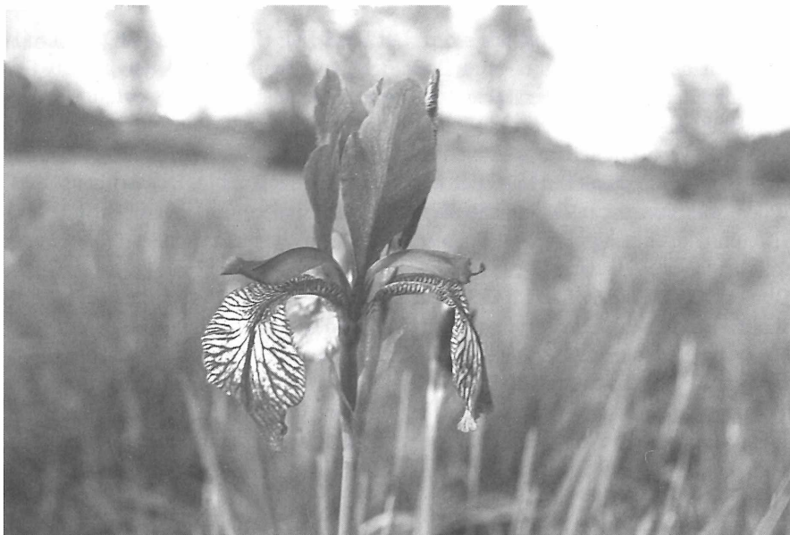
Abb.4: Die Sibirische Schwertlilie ( Iris sibirica ) ist in der wechsellrockenen Variante der typische Labkraut-Pfeifengraswiese im Unterreitnauer Moos am häufigsten.