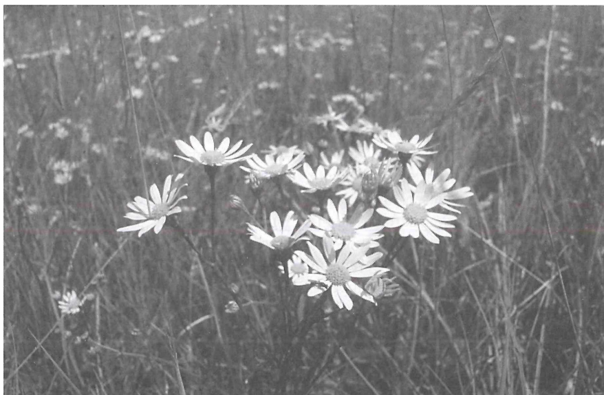
Abb.5: Wassergreiskraut-Wiesen ( Senecionetum aquatici ) sind durch Nutzungsintensivierung selten geworden.